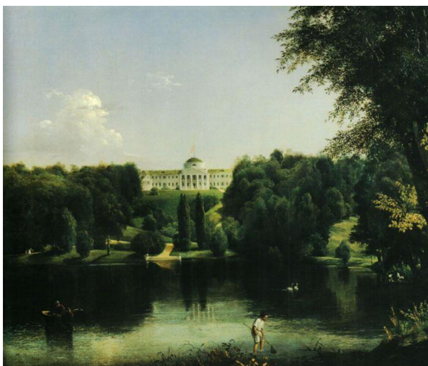
Рисунок 3 – В. Штернбер, «Садиба Тарновського»