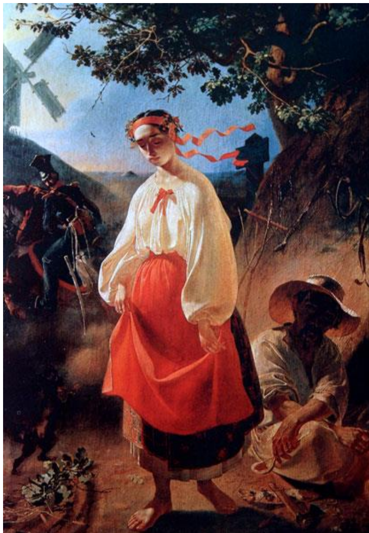
Рисунок 2 – Т. Г. Шевченко, «Катерина», 1842