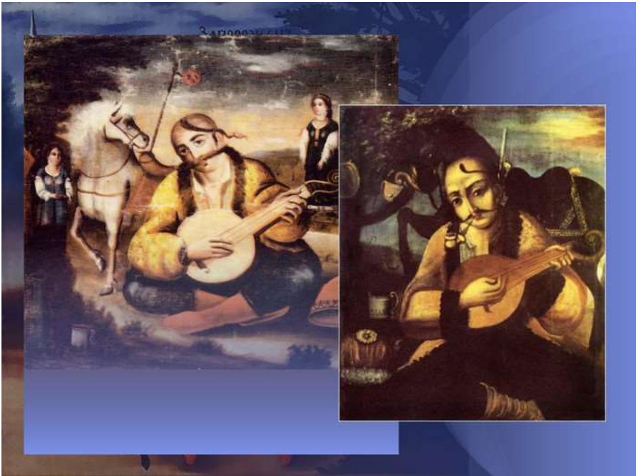
Рисунок 2 – «Козак Мамай»

Пам'ятки мистецтва із зібрання Києво-Печерського заповідника в основному, належать, до київської школи, яка в значній мірі визначила стилістичні особливості майстрів на території всієї України. Становлення стилю бароко в різних видах українського мистецтва проходило не одночасно. Нові художні тенденції в середині XVII століття знайшли своє втілення перш за все в книжковій графіці та іконописі, проявляючись у посиленні емоційного звучання релігійних сцен, у конкретизації місця дії та образів, наближення їх до народного типажу, що призвело до зміни засобів їхньої художньої виразності (рисунок 3). У ювелірному мистецтві України вже з другої половини XVII ст. помітно ускладнення форм виробів та їхньої орнаментики. Поступово предмети набувають все пишнішого декору з використанням в орнаменті листя аканта, гірлянд з квітів та плодів, стилізованих черепашок.