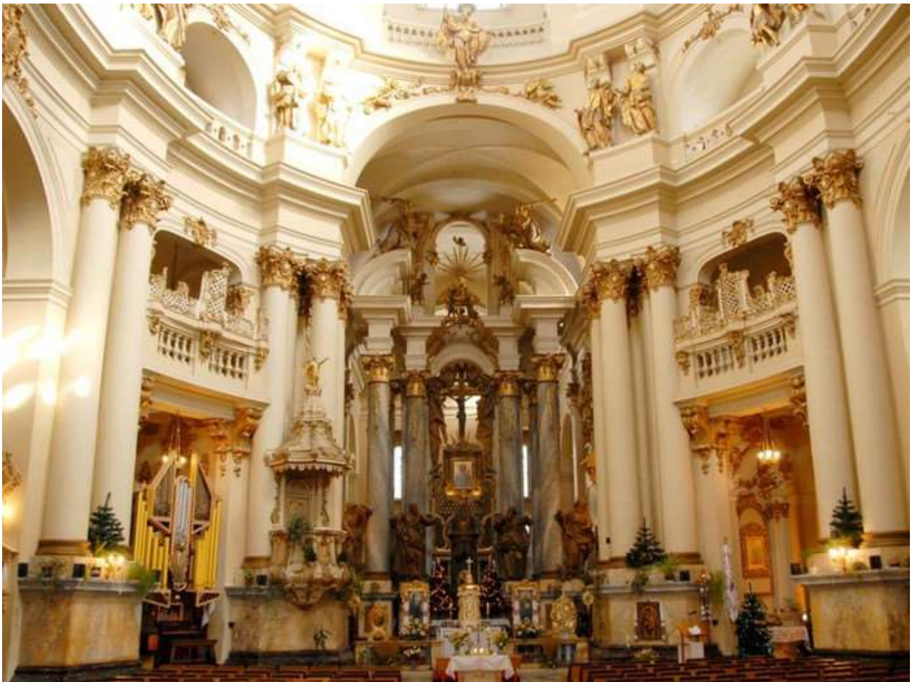
Рисунок 1 – Інтер'єр в стилі бароко

Твори образотворчого та декоративно-ужиткового мистецтва, стародруки, що належать до одного з найцікавіших періодів в історії культури українського народу — другої половини XVII — XVIII століть — часу становлення та розвитку в українському мистецтві загальноєвропейського стилю бароко. Характерною особливістю бароко є проникнення світського світогляду в усі сфери художньої діяльності.