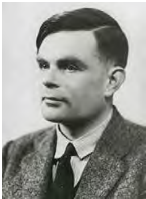
Мал. 1.24. Алан Тьюрінг

Уважається, що штучний інтелект буде здатний проявляти поведінку, яка не відрізняється від людської. Так, один з основоположників теорії штучного інтелекту Алан Тьюрінг (мал. 1.24) у своїй книзі «Чи може машина думати?» вважав, що машина стане розумною тоді, коли буде здатна підтримувати листування зі звичайною людиною, і та не зможе зрозуміти, що спілкується з машиною (так званий тест Тьюрінга). Тест вважається пройденим, якщо 30 % експертів не розпізнають штучний інтелект.