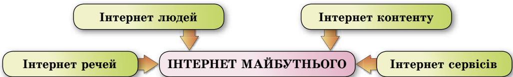
Мал. 1.32. Складові майбутнього Інтернету

Усе це створює у світі умови для нового явища — Інтернету майбутнього , що включає в себе, крім нинішнього Інтернету людей (англ. Internet of People, IoP ), ще й Інтернет речей (англ. Internet of Things, IoT ), Інтернет медіаконтенту (англ. Internet of Media, IoM ), Інтернет сервісів (англ. Internet of Services, IoS ) (мал. 1.32).