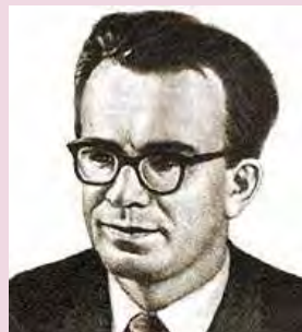
Мал. 1.28. Глушков В.М.

Значний вклад у розвиток теорії штучного інтелекту зробив Глушков Віктор Михайлович (1923–1982) — математик і кібернетик, засновник Інституту кібернетики АН України, академік і віце-президент АН України (мал. 1.28). Суть підходу Глушкова полягала в тому, що він бачив у машині не заміник людського мозку, а спеціальний інструмент, який його посилює, як молоток підсилює руку, а мікроскоп — очі. Відповідно, машина — це не конкурент людини, а його знаряддя, яке багаторазово збільшує можливості людини.