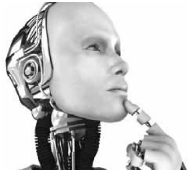
Мал. 1.25. Людиноподібний робот

Штучна нейронна мережа Google AI Experiments 2017 року розробила інструмент AutoDraw , заснований на машинному навчанні, який вгадує, що хотіла намалювати людина. AutoDraw — це інтернет-майданчик для малювання https://www.autodraw.com . Після того як штучний інтелект спрогнозує, що користувач намагався зобразити, програма запропонує кілька варіантів для уточнення. Тільки-но художник вибере із запропо-