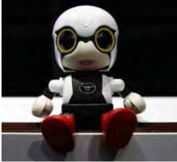
Мал. 1.26. Робот-дитина Kirobo Mini

Американська кардіологічна асоціація спільно з компанією IBM Watson планують модернізувати лікування серцево-судинних захворювань за допомогою штучного інтелекту: програма буде шукати необхідну інформацію в клінічних базах даних і наукових журналах, щоб лікарі змогли ставити точніші діагнози.