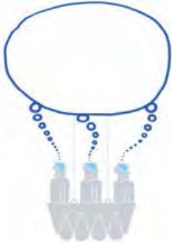
Мал. 1.33. Технологія колективного інтелекту

Уже сьогодні технології колективного інтелекту використовуються в корпоративному управлінні, у бізнес-плануванні, у сфері фінансів, політиці, соціології для генерації ідей, для прогнозування розвитку, визначення стратегій дій тощо. Результатом діяльності колективного інтелекту, наприклад, є Вікіпедія, статті для якої можуть підготувати будь-які користувачі. Широке розповсюдження сьогодні мають і віртуальні професійні спільноти, форуми тощо.