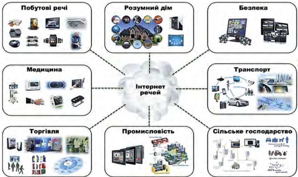
Мал. 1.30. Використання Інтернету речей

Інтернет речей об'єднує реальні речі в віртуальні системи, здатні вирішувати абсолютно різні завдання. Ключова ідея — з'єднати між собою всі об'єкти, які можна з'єднати, підключити їх до мережі для збирання даних і прийняття рішень на їх основі. Наприклад, відкрити гаражні двері, включити кавоварку або кондиціонер, виключити світло тощо (мал. 1.30).