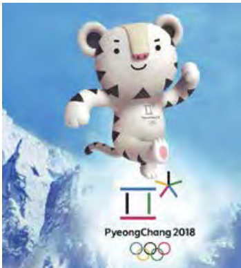
Мал. 1.27. Роботизований талісман Сохоранг

Південна Корея витратила два роки на підготовку роботів для використання їх на Зимових Олімпійських іграх 2018 року. Роботи-гіди, роботи-двірники, роботизований талісман Олімпіади білий тигр на ім'я Сохоранг (мал. 1.27) — усі вони були активними учасниками спортивного заходу.