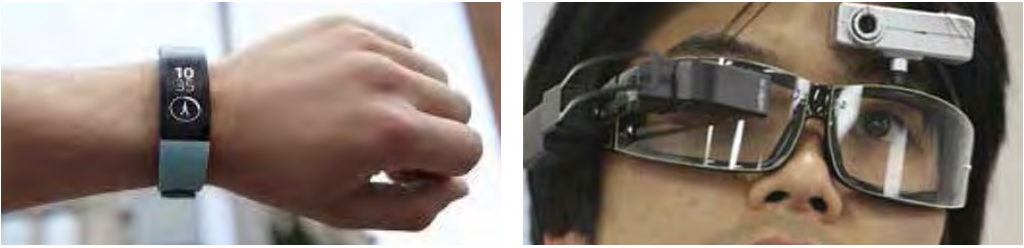
Мал. 1.31. Використання «розумних» речей

Уже сьогодні «розумні будинки» дають змогу ефективно керувати всіма системами функціонування будівлі за допомогою дистанційних пультів і мобільних телефонів, оптимально витратити тепло, воду, світло й економити на оплаті комунальних послуг тощо.