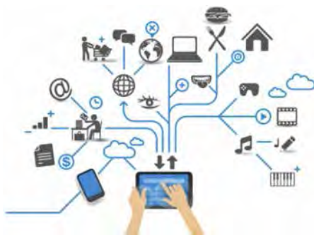
Мал. 1.29. Інтернет речей

Інтернет речей (англ. Internet of Things , скорочено IoT ) — це глобальна мережа підключених до Інтернету речей — пристроїв, оснащених сенсорами, датчиками, засобами передавання сигналів. Ці цифрові пристрої можуть сприймати датчиками різноманітні сигнали з навколишнього світу, вступати у взаємодію з іншими пристроями, обмінюватися даними з метою віддаленого моніторингу за станом об'єктів, аналізу зібраних даних і прийняття на їх основі рішень. Прикладом можуть бути гаражні двері, кавоварки, телевізори, мобільні телефони, відеокамери, датчики світла та температури тощо (мал. 1.29).