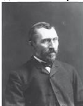
В. Ван Гог

Вінсент Віллем Ван Гог (1853—1890 рр.) народився в Зюндерте, в Нідерландах. У 27 років він зрозумів у чому його покликання в цьому житті і вирішив, що повинен будь-що стати художником. Хоч В. Ван Гог і брав уроки малювання, але його можна з упевненістю вважати самоучкою, тому що він сам студював багато книг, самовчителів, змальовував картини відомих художників, зокрема вивчав живопис імпресіонізму, японську гравюру, твори П. Гогена.