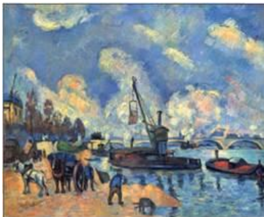
П. Сезанн. «Сена в Берсі»

передача форми співвідношеннями кольорових тонів. «Колір ліпить предмети», — стверджував П. Сезанн.