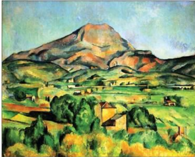
П. Сезанн. «Гора Сент-Віктуа»

У 1862 р. Поль Сезанн приїхав до Парижа з твердим наміром здобути мистецьку освіту і стати художником. У 1862—1865 рр. він навчався в Паризькій Академії Сюїса, де зблизився з Камілем Піссарро, Едуаром Мане, Клодом Моне. У 1874 і 1877 роках бере участь у виставках імпресіоністів.