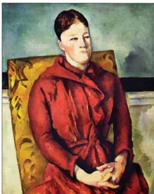
П. Сезанн. Мадам Сезанн у жовтому кріслі