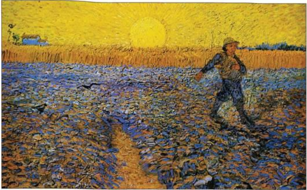
В. Ван Гог. «Згряя гав над пшенишним полем»

Видатний художник помер у 37 років. «Немає нічого більш художнього, ніж любити людей» — цей девіз художника був втілений в усій його творчості.