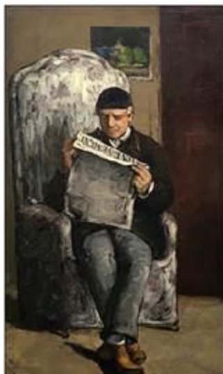
П. Сезанн. Портрет Луї-Огюста Сезанна, батька художника, який читає «Евнеман»