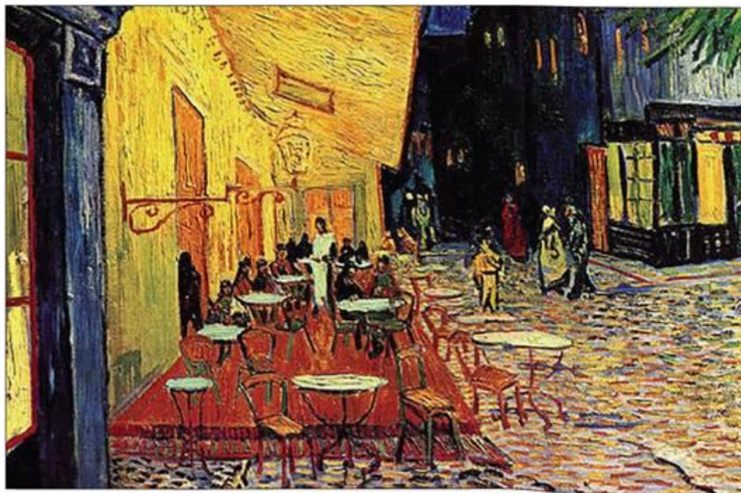
В. Ван Гог. «Тераса нічного кафе»

картинах свій настрій і душевний стан — іноді різкими, уривчастими, загостреними, а іноді — закругленими, ритмічно повторюваними.