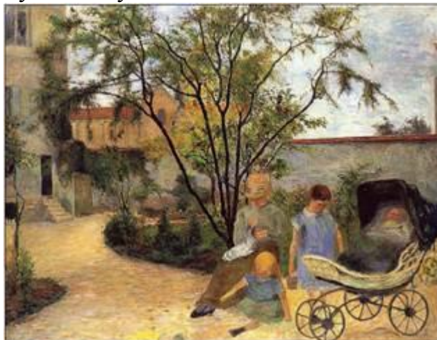
П. Гоген. «Сім'я в саду»

Після участі в 5 виставках імпресіоністів, художник вирішив повністю присвятити себе живопису. Своїм учителем він вважав Каміля Піссарро.