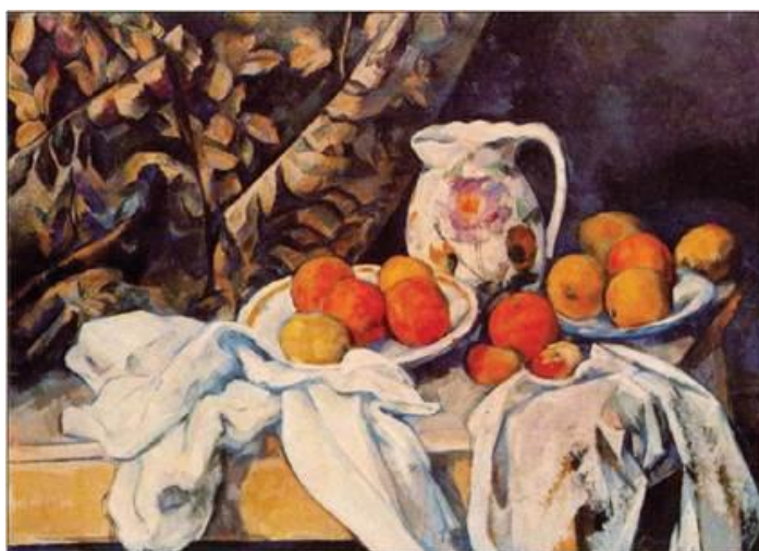
П. Сезанн. «Натюрморт із драпіруванням і глечиком»

У натюрмортах, пейзажах, портретах художник прагнув виявити незмінні якості наочного світу, його пластичне багатство, логіку структури, велич природи і органічну єдність її форм, за допомогою градацій чистого кольору, стійких композиційних побудов. Художник повернув фігурам і тілам вагомість, об'ємність і матеріальність, втрачену імпресіоністами. Він стверджував, що працює не з натури, а «паралельно натурі».