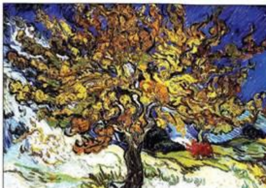
В. Ван Гог. «Дерево»