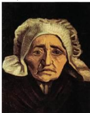
В. Ван Гог. «Селянка»

Пізніше палітра В. Ван Гога стає світлою, зникли землисто-гогого відтінку фарби, з'явилися чисті блакитні, золотаво-жовті, червоні тони, характерний для нього динамічний, ніби бризкотливий, мазок.