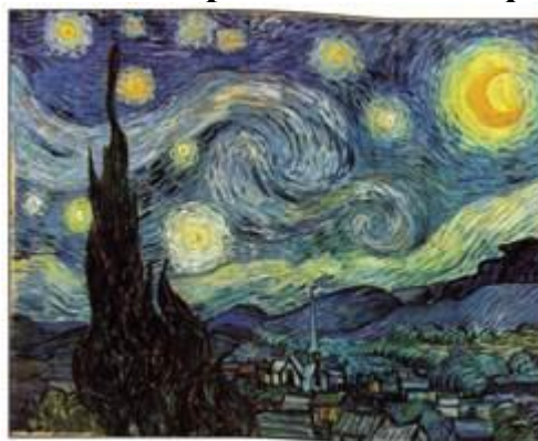
В. Ван Гог. «Зоряна ніч»