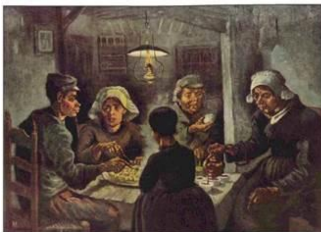
В. Ван Гог. «Їдці картоплі»

У В. Ван Гога кожен твір мав суб'єктивний характер. Особливу увагу митець приділяв кольору. Він прагнув висловити своє ставлення до зображуваного ним за допомогою колірних співзвуч. Пейзажі цього художника подібні душі людини — в них також відбувається «зіткнення пристрастей»: скелі здригаються, а дерева волають про допомогу. Колір у художника стає головним виразником емоцій. В. Ван Гог стверджував, що є кольори, які «люблять» або «ненавидять» один одного, тому їх контраст або гармонія здатні висловити різноманітний стан художника. Він міг саме мазками передавати в