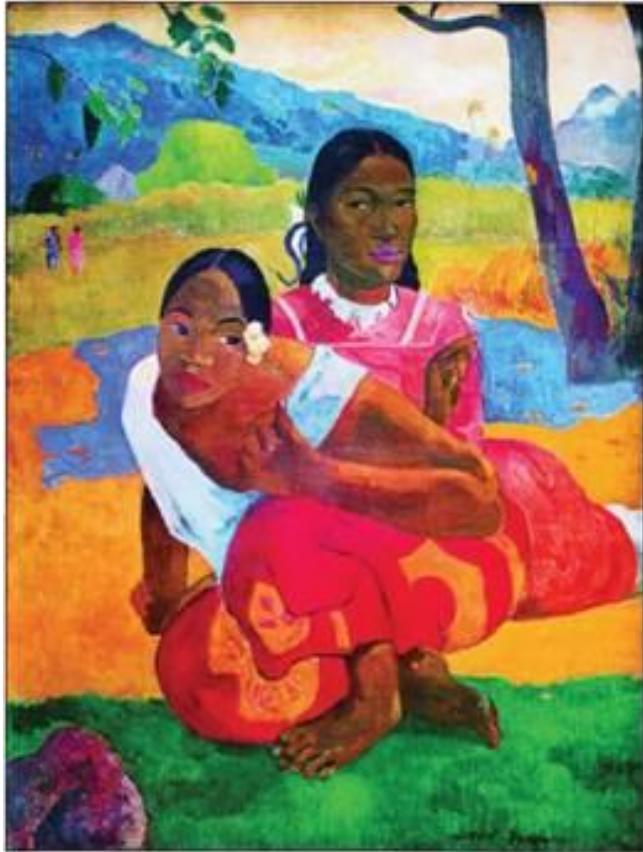
П. Гоген «Коли весілля?»