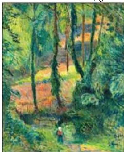
П. Гоген. «Лісиста стежка»

Коли у середині 1880-х років почалася криза імпресіонізму, П. Гоген почав шукати свій шлях у мистецтві. Він відійшов від імпресіонізму і виробив власний стиль — синтетизм. Цьому стилю властиве спрощення зображення, переданого яскравими, незвично сяючими фарбами, і навмисно надмірна декоративність. П. Гоген намагався зрозуміти внутрішній дух кожної картини. Багато його картин мають подвійні назви (його власна і рядок із будь-якого твору). Він використовував поширене порівняння мистецтва з дзеркалом, стверджуючи, що в його творах відбивається не зовнішній вигляд зображуваних фігур і предметів, а духовний стан художника. Митець говорив, що зображує не реальне життя, а свої мрії про нього, що він хотів звернутися в своєму мистецтві до тем вічних, позачасових, утілити мрію про гармонійність навколишнього світу, злиття людини з природою, фактично проклав шлях символізму і модерну.