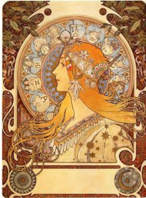
А. Муха "Зодіак"

Австрійський художник Гюстав Клімт (1862-1918) – один з найголовніших представників стилю модерн. На початку творчого шляху він оформляв віденські театри і музеї. В 1897 р. Клімт очолив віденський Сецесіон – Об'єднання художників Австрії, які прагнули порвати з академічним мистецтвом і створити нову систему.