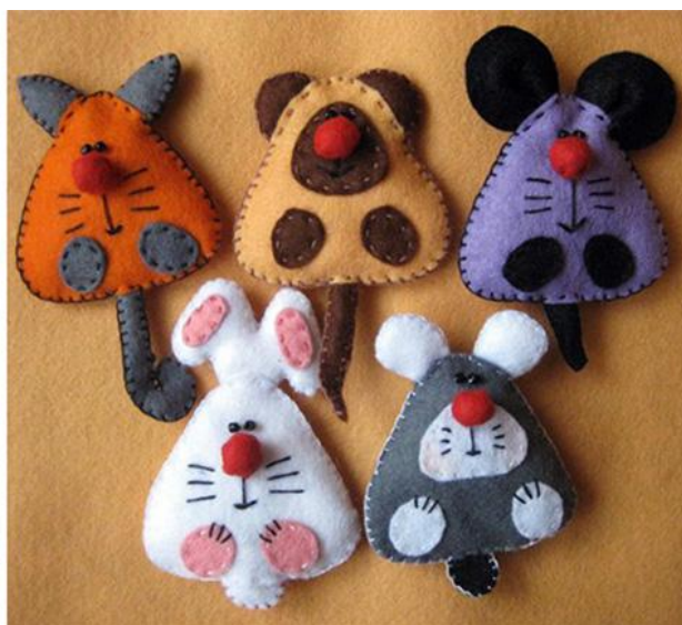
Рисунок 3 – Плоскі іграшки (робляться власноруч)