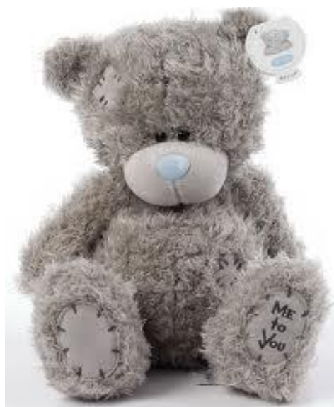
Рисунок 1 – Американська іграшка - ведмежатко Тедді ( Teddy Bear ).

М'які іграшки – один з найпопулярніших видів дитячих іграшок. Вони викликають особливу ніжність і прихильність. Пухнасті, милі і добрі – м'які іграшки дуже подобаються дітям і навіть багатьом дорослим. Їх дарують на дні народження, ними прикрашають кімнату, та й просто - їх дуже люблять. Дивись рисунок 1.