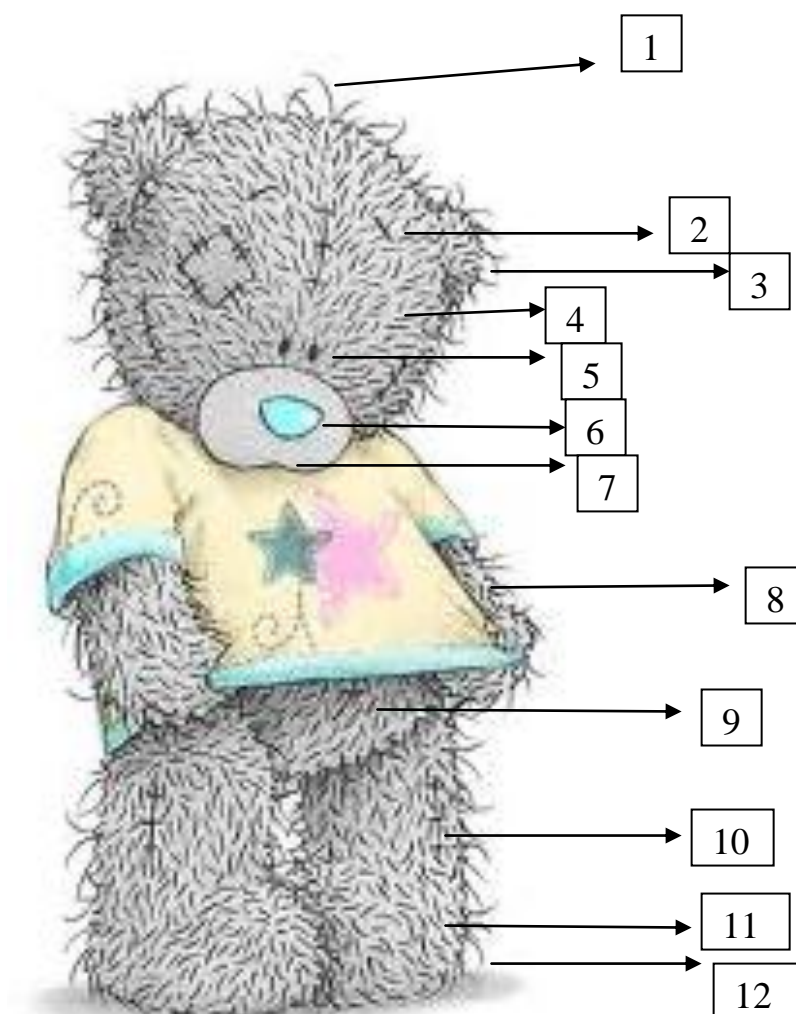
Рисунок 2 – Схема прототипу американської іграшки: - ведмежатко Тедді ( Teddy Bear ).