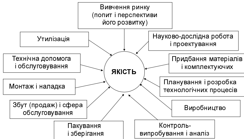
Рис. 2.1. "Петля якості", або етапи, на яких забезпечується якість

Організаційним факторам, на жаль, ще не приділяється стільки уваги, скільки технічним, тому дуже часто добре спроектовані і виготовлені вироби в результаті поганої організації виробництва, транспортування, експлуатації і ремонту достроково втрачають свою високу якість.