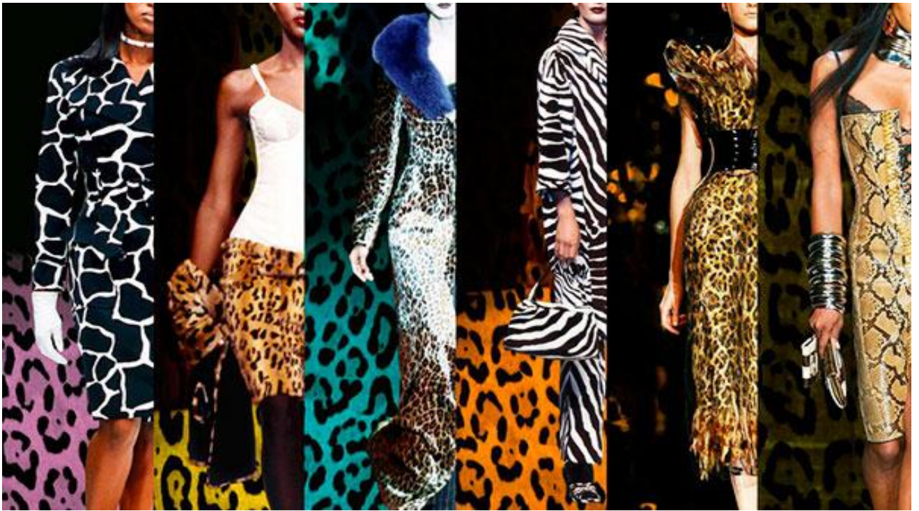
1996 р., колекція Animal Print, яка ввела моду на «хижі» принти