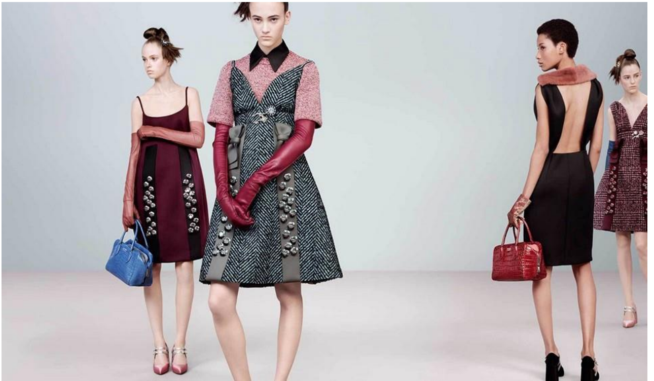
Колекція Prada весна-літо 2018 р.