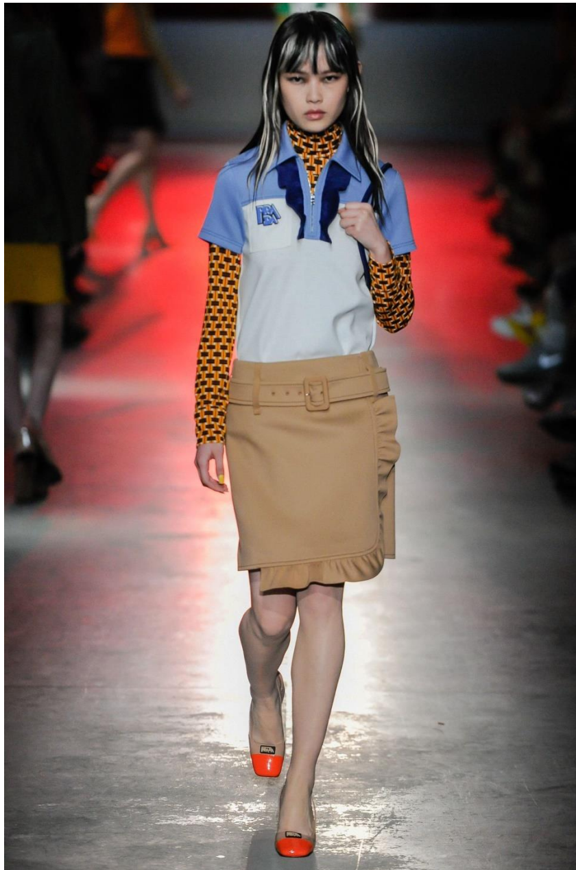
Модель з колекції одягу лейблу Miu Miu

1993 рік ознаменувався випуском першої чоловічої колекції Prada та створенням бренду одягу Miu Miu. Саме так називають Міуччу найближчі друзі та рідні. Новий напрямок з простих кольорів і фасонів розроблявся виключно для молодих людей, які хочуть носити якісний модний одяг, але не можуть собі дозволити витратити на нього шалені гроші. У 1997 році на загальній була представлена лінія деніму Prada Linea Rossa, а у 1998 році лінія Prada Sport — одяг для спорту й відпочинку. Портфоліо бренду постійно розширюється. Крім одягу та предметів розкоші в ньому постійно з'являються найнесподіваніші новинки. У 1995 році Міучча і Патріціо заснували фонд сучасного мистецтва "Prada", що став найбільш значущим в Італії. Культурна установа займається підтримкою та демонстрацією робіт сучасних художників в усьому світі.