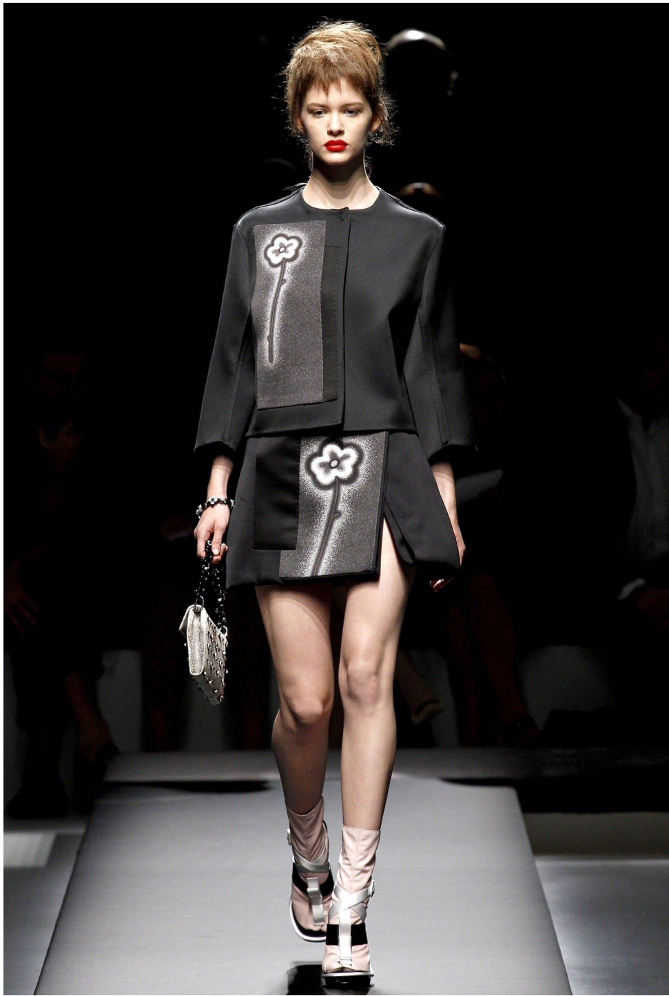
Колекція Prada осінь-зима 2021 р.