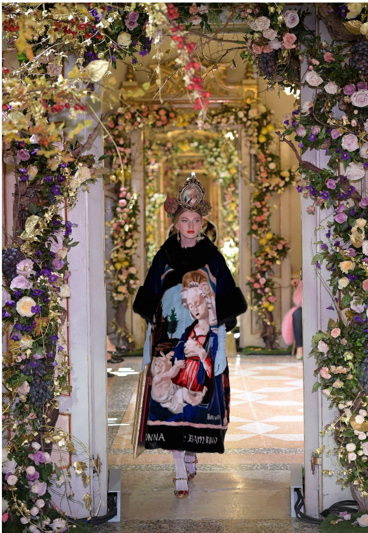
Картини Тиціана в колекції «від кутюр» Dolce & Gabbana