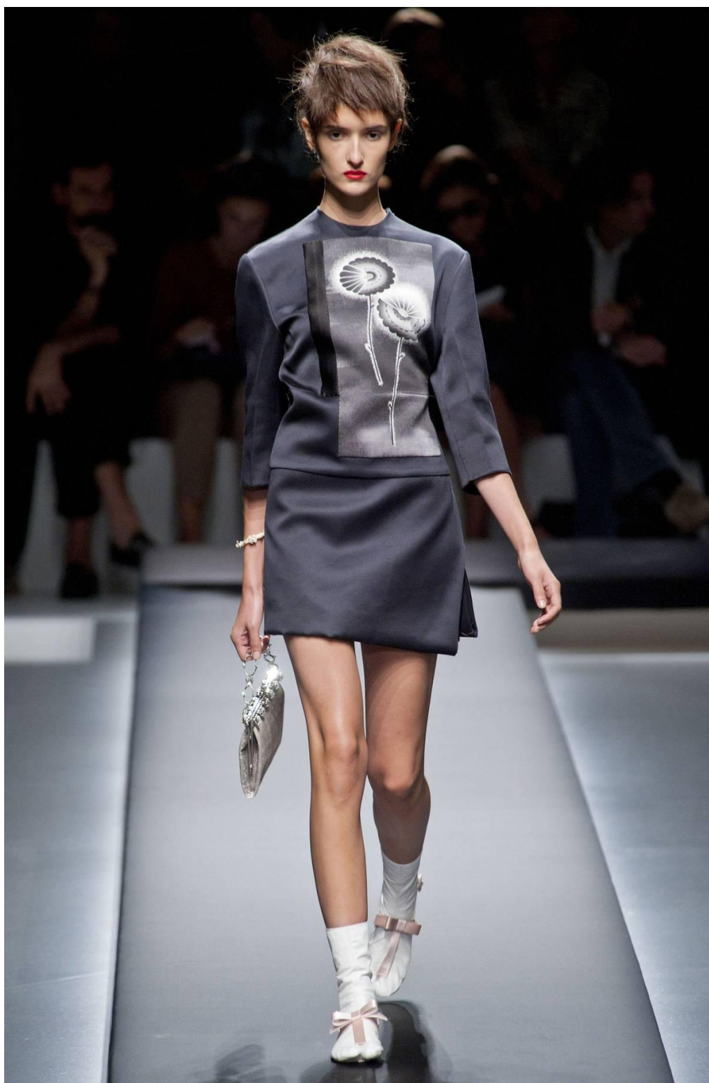
Колекція Prada осінь-зима 2021 р.