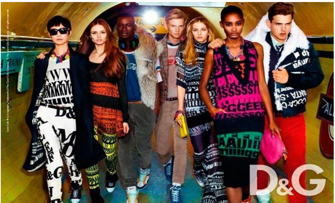
1995 р. Dolce & Gabbana Basic – лінія базових речей, джинсів, окулярів, яка знайшла багатьох прихильників