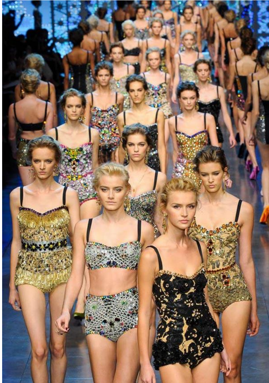
Коллекція нижньої білизни від Dolce & Gabbana