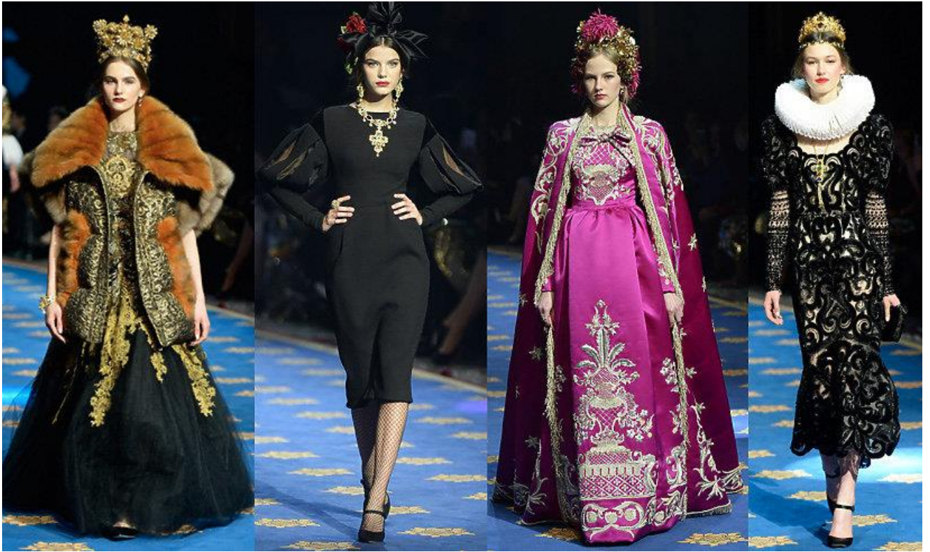
Колекція «від кутюр» Dolce & Gabbana, присвячена опері