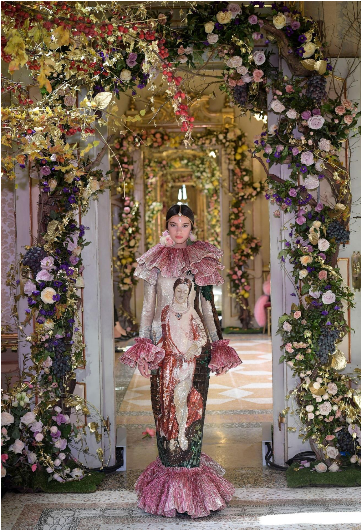
Картини Тиціана в колекції «від кутюр» Dolce & Gabbana