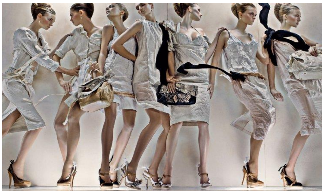
Колекція Prada 2009 р.

У 2000 році дизайнерами бренду була розроблена перша колекція окулярів, а у 2004 р. світу був представлений перший аромат від Prada. Через сім років спільно з LG Electronics Prada випускає телефон LG Prada. Через два — з’явилася нова модель телефону, яка підключається до наручного годинника Prada Link. У 2011-му з’являється Android-смартфон LG P940 — третє покоління телефонів Prada. У 2010 році компанія Prada придбала італійський бренд взуття Alberto Moretti Car Shoes. У 2011-му компанія розробила форму італійської збірної з вітрильного спорту для Олімпійських ігор 2012-го. У 2012 році бренд повідомив про зростання своїх доходів на 29%, а його продажі досягли €3,29 млрд за рік. Відповідно, Міучча зайняла 67-е місце в жіночій сотні Forbes.