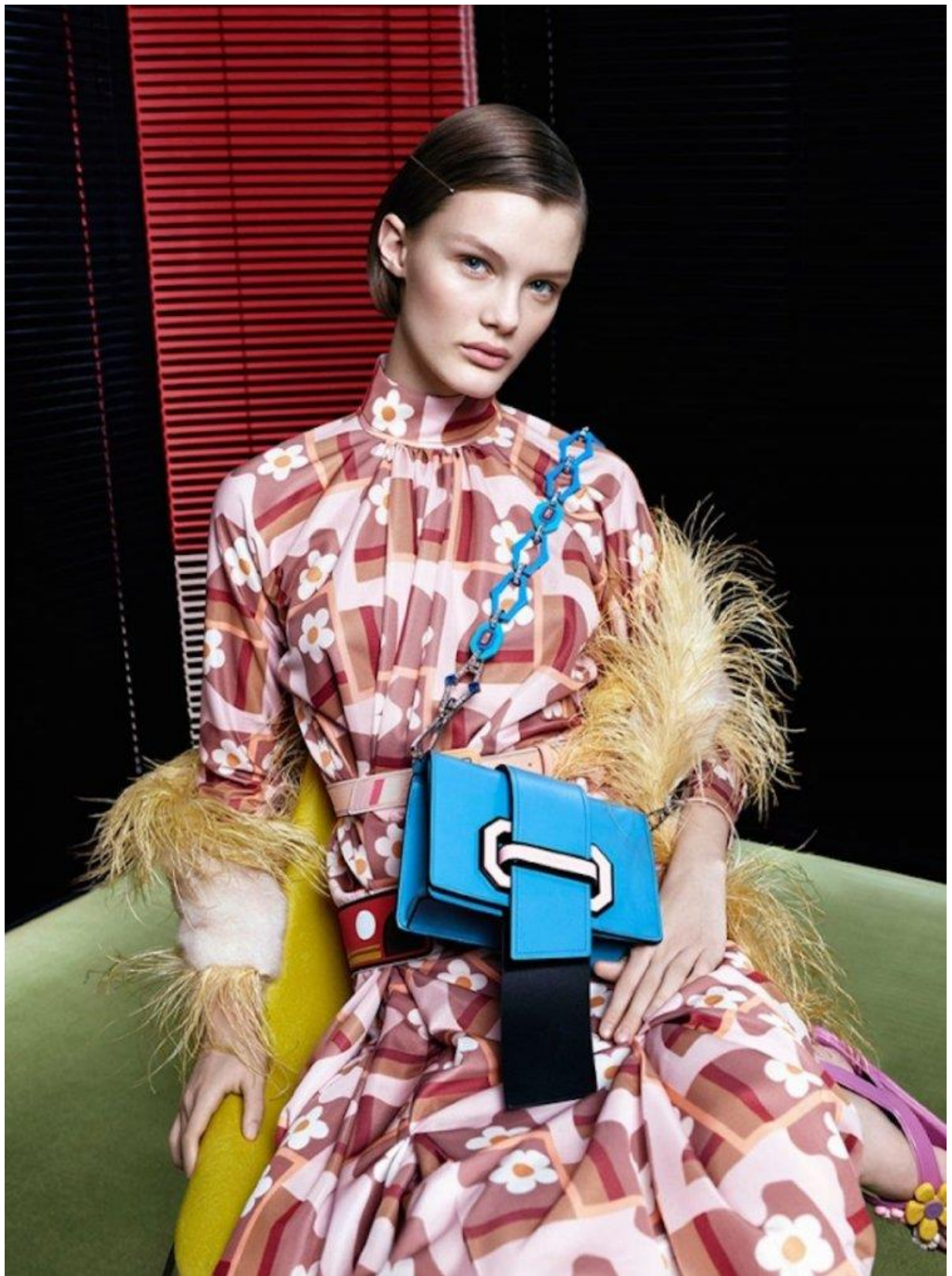
Колекція Prada весна-літо 2020 р.