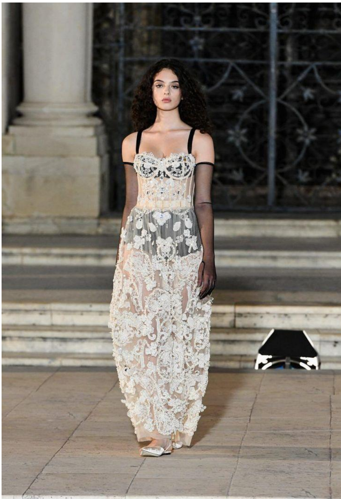
Сукня-бюстье від Dolce & Gabbana