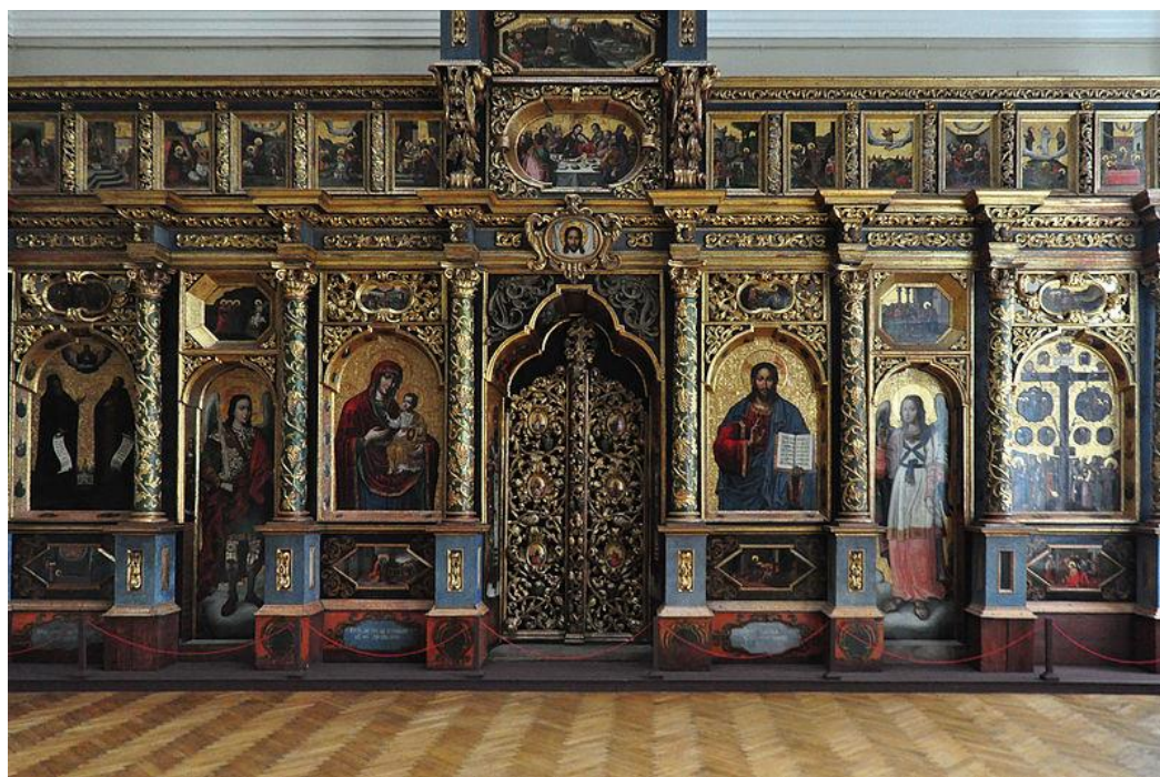
Рисунок 2 – Богородчанський іконостас Йова Кондзелевича