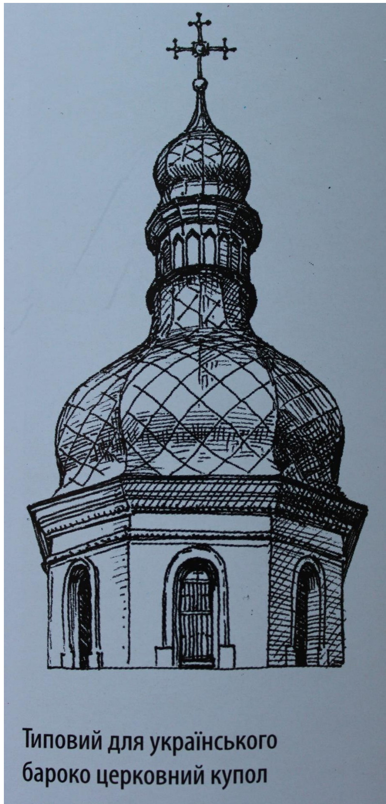
Рисунок 3 – зразок для оформлення графічної частини роботи