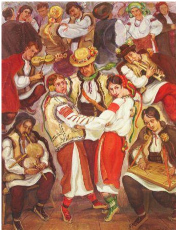
Рисунок 3 – О. Кульчицька, «Гуцульське весілля», 1943р.