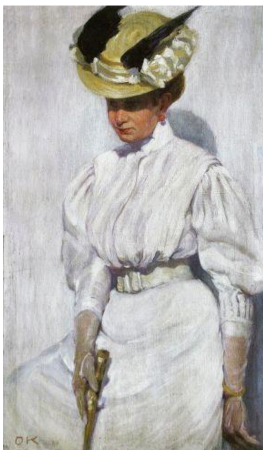
Рисунок 4 – О. Кульчицька, «Портрет сестри в білому», 1912р.