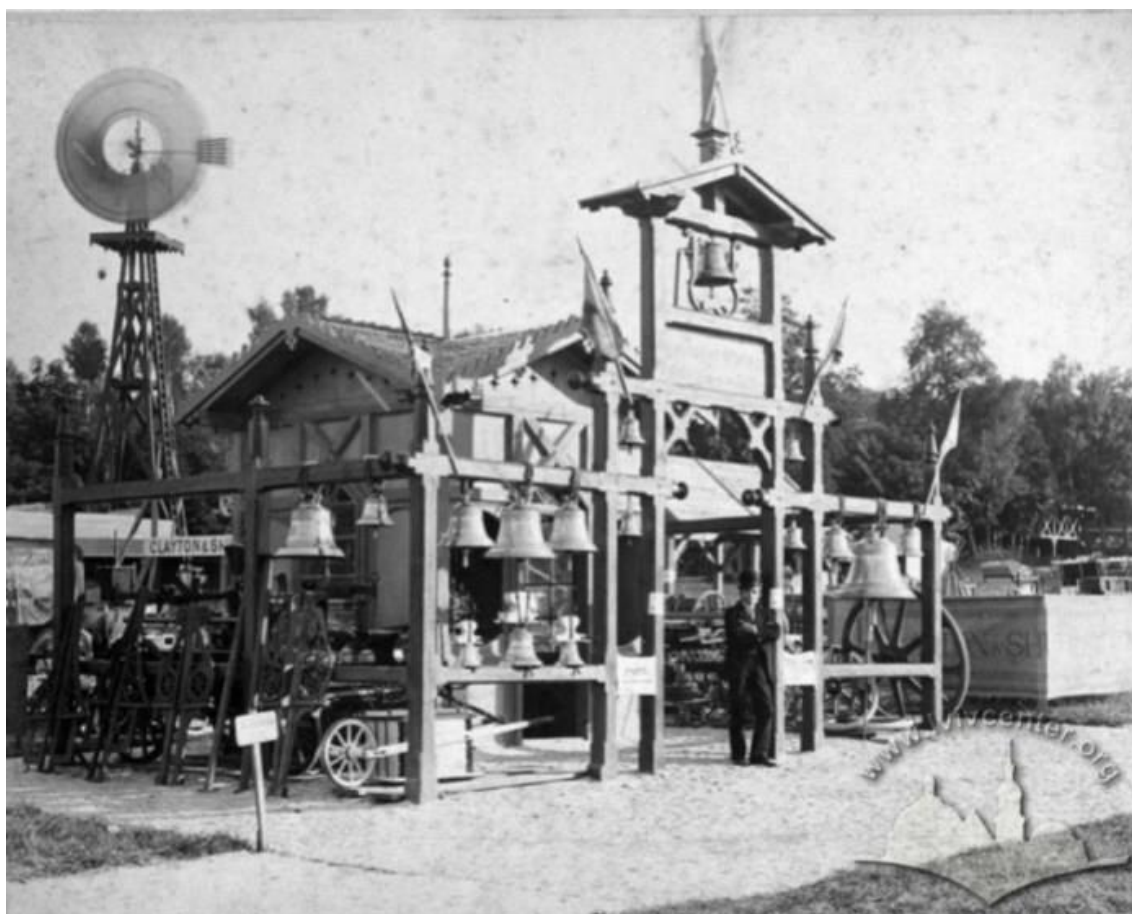
Рисунок 8 - Павільйон із продукцією фабрики металевих виробів Зигмунта Мозера. Фото 1877 року