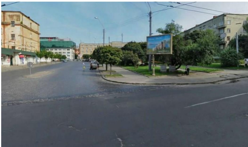
Рисунок 5 - Площа Петрушевича у Львові, вид з вулиці Шота Руставелі. Фото наших днів