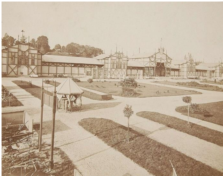
Рисунок 5 - Павільйони рільничо-промислової виставки на пляжу Яблонівських (нині-площа Петрушевича). Фото 1877 року

На Київщині народними промислами займалося Київське кустарне товариство, очолюване М. Біляшевським, Г. Павлуцьким та Д. Щербаківським. Воно організувало кустарні склади, влаштувало декілька виставок. Твори народного мистецтва поширював також магазин товариства «Просвіта» в Києві.