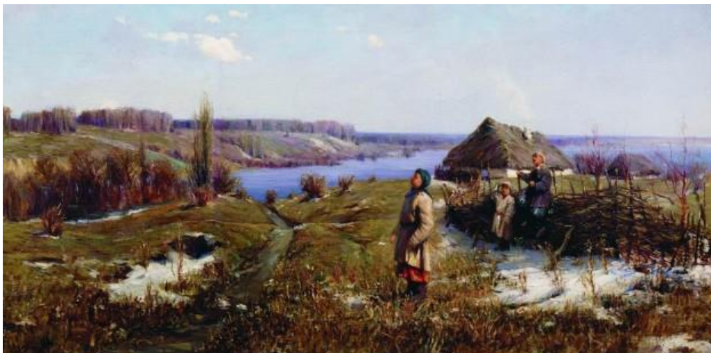
«Весна в Україні»