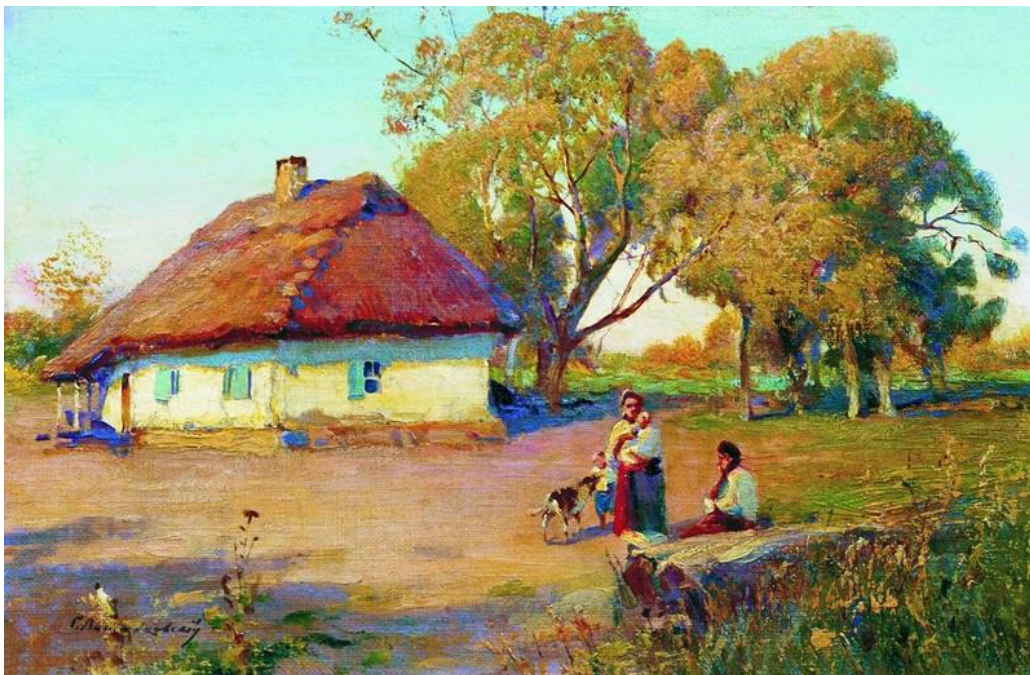
«Полтавицина. Тихий вечір»