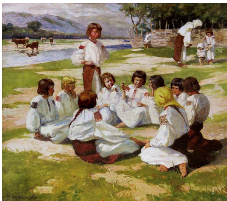
Рисунок 2 – О. Кульчицька, «Діти на Леваді», Косів, 1908р.

Значний внесок у вивчення та пропаганду народного прикладного мистецтва зробили художники С. Васильківський (Рисунок 1), В. Кричевський, І. Левинський, М. Самокиш, П. Сластіон, О. Кульчицька (Рисунок 2, 3, 4) та ін.