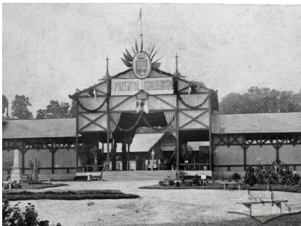
Рисунок 7 - Головний павільйон виставки 1877 року у Львові. Фото 1877 року