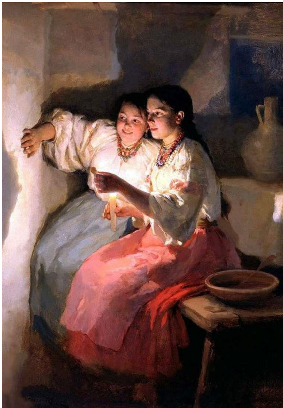
Рисунок 6 – «Святочні ворожіння», М. Пимоненко

Видатним майстром побутового жанру був М. Пимоненко. Більшість його робіт, написаних на теми селянського життя, відрізняються щедрістю, емоційністю, високою живописною майстерністю: «Святочні ворожіння» (Рисунок 6), «Весілля в Київській губернії», «Проводи рекрутів», «Свати», «Жнива», «По воду», «Ярмарок», інші. Пимоненко — автор близько 715 картин і малюнків. Він один з перших у вітчизняному малярстві поєднав побутовий жанр і поетичний український пейзаж.