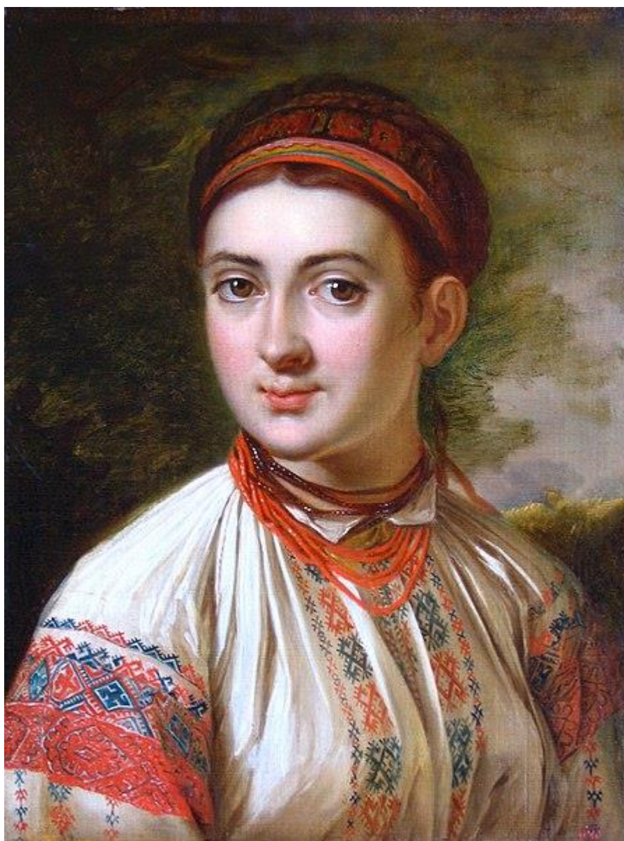
Рисунок 4 – В. Тропінін «Дівчина з Поділля»

В. Тропінін залишався кріпаком навіть вже будучи відомим художником, багато років він жив і працював у Подільському маєтку своїх добродіїв. Саме тут відбувається становлення його, як митця та майстра, він детально знайомиться з іконописною традицією. Тропінін говорив, що Україна замінила йому Академію. Він пише безліч портретів («Дівчина з Поділля» (Рисунок 4), «Хлопчик з сокирою», «Весілля в селі Кукавці», «Українець», «Портрет подільського селянина»), демократизм і реалізм яких були новаторськими. Після звільнення Тропінін жив у Москві. Знаменитий портрет О. С. Пушкіна його роботи. І. Сошенка, який залишився після Академії в Петербурзі, у своїй творчості не забував Україну (наприклад, «Продаж сіна на Дніпрі», «Ріка Рось біля Білої Церкви», «Хлопчики-рибалки»).