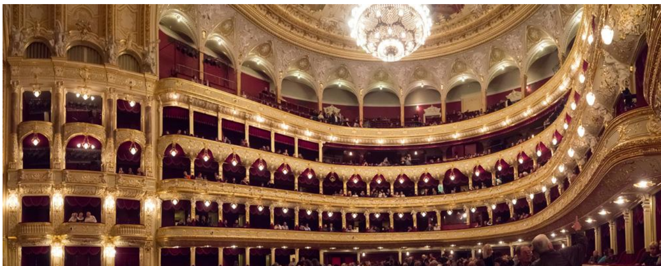
Рисунок 1 – Оперний театр в Одесі

Пошук все більшої різноманітності викликав інтерес і до візантійсько-російських традицій. Вони чітко простежуються у будові найбільшого у Києві кафедрального Володимирського собору (Рисунок 2), який споруджувався понад 20 років (1862–1886) за проектами І. Штрома, П. Спарро, О. Беретті. Участь у