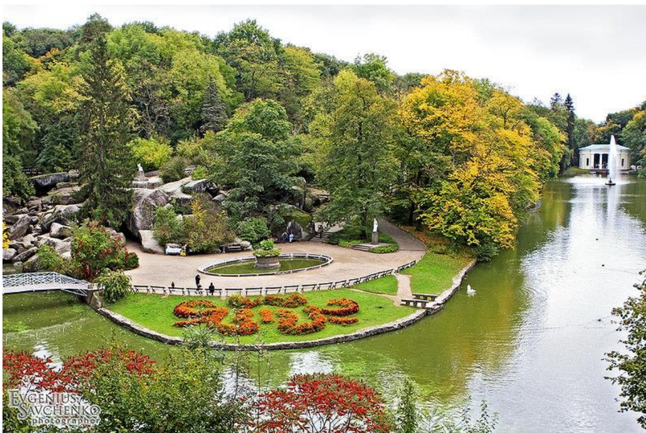
Рисунок 3 – парк «Софіївка» в Умані

Майстерність і талант українського народу виявилися у створенні палацово-паркових ансамблів. Їх автори, як правило, нам невідомі. Народні майстри створили видатні шедеври архітектурного зодчества: палац Розумовського у Батурині в живописній місцевості над Сеймом, палац Галагана в Сокирницях на Чернігівщині, до якого прилягає лісопарк площею 600 десятин, парк «Олександрія» на березі Росі в Білій Церкві, знаменита «Софіївка» в Умані (Рисунок 3), де руками кріпаків, без використання якої-небудь техніки були насипані гори, викопані ставки.