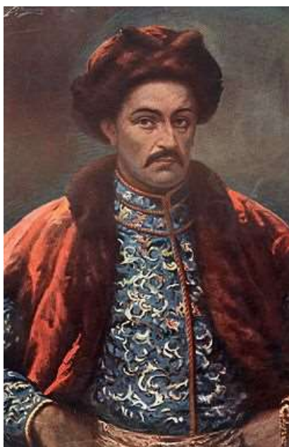
Рисунок 4 – Гетьман Іван Мазепа