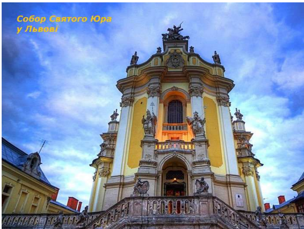
Рисунок 2 – Собор святого Юра у Львові

«загальноєвропейське» бароко, але і тут найвидатніші пам'ятки не позбавлені національної своєрідності: Успенський собор Почаївської лаври, собор св. Юра у Львові (Рисунок 2), а також собор св. Юра Києво-Видубицького монастиря, Покровський собор у Харкові, Георгіївська церква Видубицького монастиря у Києві (Рисунок 3) та ін.. Продовженням бароко став творчо запозичений у Франції стиль рококо. В ньому перебудовано Київську академію, дзвіниці Києво-Печерської Лаври, Софіївського собору, головної церкви в Почаєві.