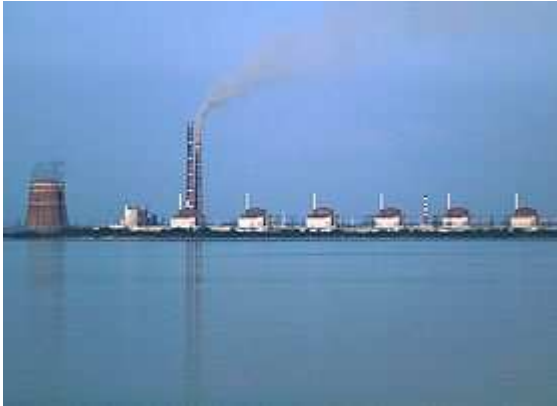
Рис. 1.1 – Запорізька АЕС – найбільша електростанція Європи

обсяг ССВЯП для Запорізької АЕС – 380 контейнерів, що забезпечить на найближчі 50 років зберігання відпрацьованих паливних збірників, які будуть вилучатися з реакторів протягом усього терміну експлуатації станції. Аналогічні сховища планують побудувати на інших АЕС.