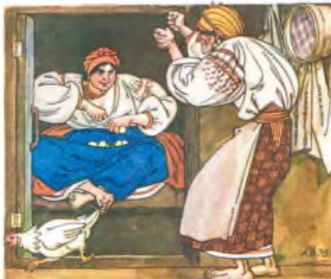
А. Базилевич. Ілюстрація до повісті І. Нечуя-Левицького «Кайдашева сім'я»

Одна курка впала з горища й погасила світло. У сінях стало поночі. Лаврін стояв, сп'явшись на драбину. Мотря штовх-