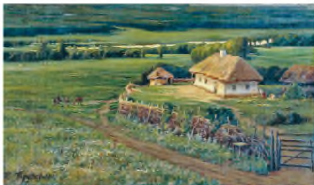
К. Трутовський. Малоросійський пейзаж

— От, прокляті! Каторжні!.. Через них знівечила держално... — на весь голос гукала молодиця й кинула у свиноту надтріснутим держалном.