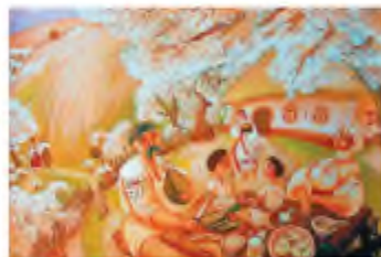
M. Михайлошина , Садок вишневий коло хати