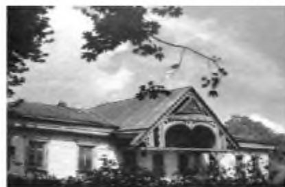
Будинок Є. Чикаленка. Фото початку ХХ ст.