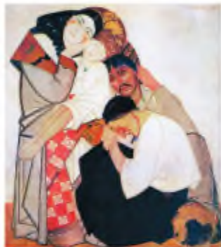
Ф. Кричевський. Центральна частина триптиха «Життя»

І все ж найвизначніші досягнення мала художня література . У цей час на ниві рідного слова виступали представники різних напрямів: продовжували реалістичну традицію Панас Мирний, Іван Нечуй-Левицький, Олена Пчілка, Михайло Старицький, Іван Карпенко-Карий, Марко Кропивницький, Павло Грабовський, Борис Грінченко. Деякі автори (Іван Франко, Михайло Коцюбинський) почали працювати як реалісти, а потім поступово перейшли на позиції нового світосприймання. Молодші ж письменники відразу вибрали шлях модернізму . Це Ольга Кобилянська, Леся Українка, Василь Стефаник, Володимир Винниченко, Олександр Олесь, Богдан Лепкий, Микола Вороний, Архип Тесленко, Гнат Хоткевич і багато інших талановитих митців.