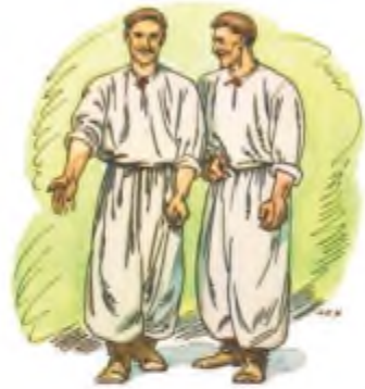
А. Базилевич. Ілюстрація до повісті І. Нечуя-Левицького «Кайдашева сім'я»

Цікаво, що в повісті майже немає сцен, у яких би лунав сміх. Герої «Кайдашевої сім'ї» – дуже серйозні люди. Їм не до сміху, оскільки всі вони – учасники великої родинно-побутової війни, якій не видно кінця. І. Франко вважав, що «І. Нечуй-Левицький малює в “Кайдашевій сім'ї” гірку картину розпаду українського патріархалізму під впливом індивідуалістичних змагань кожного її члена». Справді, роль батька в Кайдашів зведено на нівець. Омелько Кайдаш , по суті, ніяк не впливає на перебіг подій у власній хаті. Він пливе за течією, а коли й пробує якось утруднитися в домашні чвари, то зазнає поразки. Образ голови родини – трагікомічний: з одного боку, він богобоязливий, палко вірить у святу Параскеву-П'ятницю, яка ніби рятує від наглої смерті й не дасть потонути у воді, а з іншого – любить «заглядати в чарку» , що потім його погубила, до речі, у ту ж таки п'ятницю. Омелько не може зрозуміти й цілком природного бажання синів мати свою землю, тобто відчувати себе господарями.