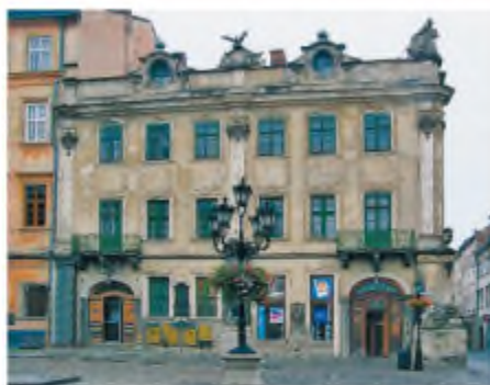
Товариство «Просвіта». м. Львів. Сучасне фото