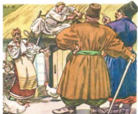
А. Базилевич. Ілюстрація до повісті І. Нечуя-Левицького «Кайдашева сім'я»

У неї з ока потекла кров. Лаврін і Мелашка побачили кров і розлютувалися. Вони кинулись оборонять матір. Лаврін пхнув Мотрю. Мотря дала сторчача на лаву. Карпо кинувсь обороняти Мотрю та пхнув Лавріна. Лаврін ударився об мисник. Три полумиски, захищені Лавріном од ваглої смерті, посипалися йому на голову.