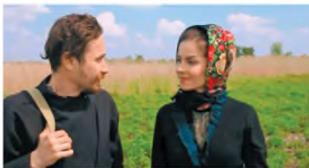
Кадр із кінофільму «Момент» за однойменною повеллю В. Випивченка (реж. О. Тесленко)

Ми увійшли в кущі й, вибравши місце, звідки нам було видно ліс, а нас самих не видно, сіли.