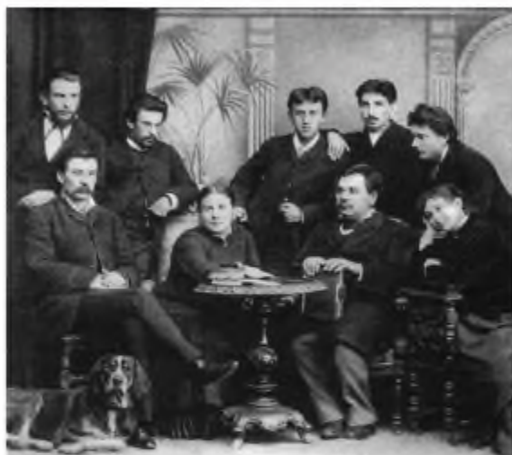
Артисти «Театру корифеїв». 1886 р.

землях України. Однойменні товариства виникли в багатьох містах Галичини — Перемишлі, Станіславі (нині Івано-Франківськ), Тернополі та ін.