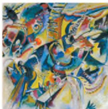
В. Канди́нський. Імпровізація. Ущелина