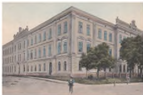
Коломийська гімназія. Наприкінці XIX ст. – перша половина XX ст.

У гімназії Василь таємно організував ушанування пам'яті Т. Шевченка, відкрив у рідному селі читальню, входив до таємного гуртка гімназистів, у якому читали українські книжки. Через антиімперську діяльність В. Стефаніка, як і Л. Мартовича та багатьох інших гімназистів-українців, було виключено з навчального закладу. Друзі перейшли навчатися в Дрогобицьку гімназію. Тут В. Стефаник познайомився з І. Франком.