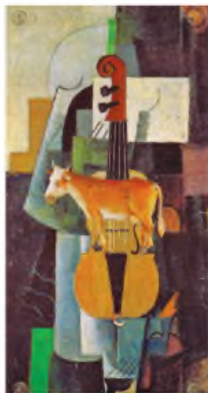
К. Малевич. Корова і скрипка

2. Наступний етап – власне модернізм . Це період розквіту напряму, який тривав від початку до другої половини XX ст. У цей період працювала ціла плеяда видатних митців – від Франца Кафки, Василя Стефаника, Івана Франка, Джеймса Джойса, Лесі Українки, Андрія Платонова, Миколи Хвильового до Джорджа Орвела, Ернеста Хемінгуея, Германа Гессе, Вільяма Фолкнера, Габрієля Гарсія Маркеса, Ліни Костенко, Євгена Євтушенка, Чеслава Мілоша, Василя Симоненка, Івана Драча, Василя Стуса. У цей час найвиразніше виявилися згадані вище ознаки модернізму.