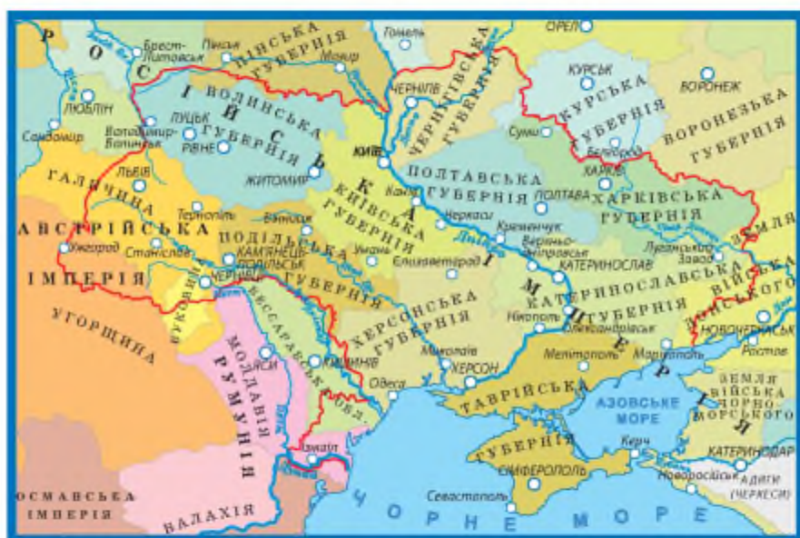
Карта українських земель другої половини ХІХ ст.