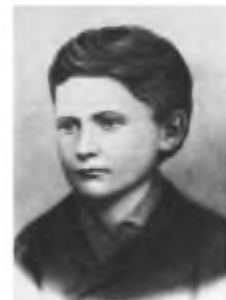
Іван Франко. 1870 р.

У той час уми передових діячів Європи заповнили новомодні соціалістичні ідеї, які, здавалося, дадуть свободу та щастя людині й нації. Молоді небайдужі галичани (насамперед завдяки старанням М. Драгоманова) теж підтримували ці ідеї. І. Франкові це захоплення обійшлося надто дорого. У 1877 р.