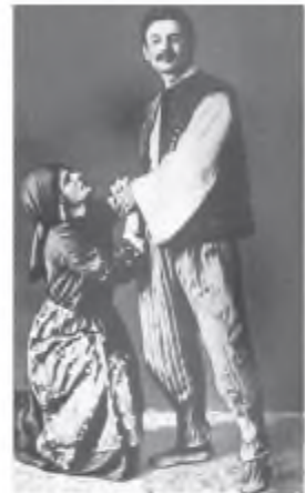
Вистава «Осінь буря» театру «Руська бесіда». У головних ролях – Лесь Курбас і Катерина Рубишкова. 1914 р.

Формується модерний національний стиль у музиці . Це поєднання фольклорної традиції з ускладненням ладотональних відносин, збагачення гармонії (видатні молоді