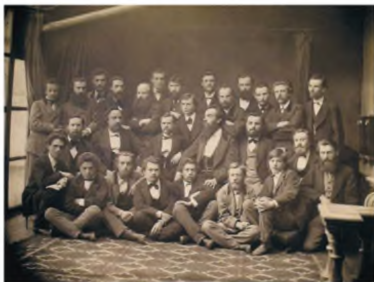
«Стара громада». Фото, 1874 р.

Осередком національно-культурної роботи в 70–90-х роках XIX ст. стала «Стара громада» (Київ), членами якої були В. Антонович, М. Драгоманов, П. Житецький, І. Нечуй-Левицький, М. Лисенко, Т. Рильський та ін. (майже 70 осіб). Так розпочався рух, що став одним з основних духовних витоків відродження України. Російське самодержавство відповіло на це пожвавлення Емським указом 1876 р., що забороняв друкування літератури українською мовою в Росій-