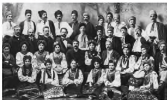
Театральна група братів Тобілевичів. 1895 р.

потаємніші глибини українського степу, символізуючи собою й першу найголовнішу любов І. Карпенка-Карого — драматургію. До нього вона була в українській літературі привагідною й епізодичною; після нього здобулася на професійний статус; професійним став і український театр».