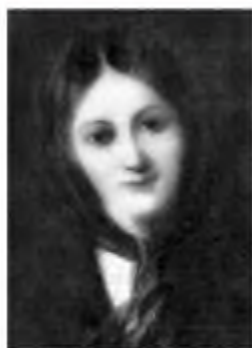
М. Рейзнер. Портрет незнайомки

І. Франко дуже дорожив картиною художника М. Рейзнера «Портрет незнайомки», яку випадково побачив у крамниці й зразу ж купив. Цю скромну роботу письменник помістив у своєму кабінеті над робочим столом. Дослідники вважають, що це портрет саме Юзі, єдине зображення дівчини, яке збереглося.