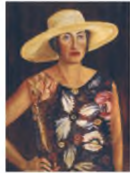
В. Винниченко. Портрет дружини

Його п'єси «Брехня», «Чорна Пантера і Білий Ведмідь», «Закон», «Гріх» перекладали європейськими мовами й ставили в театрах багатьох країн. Так само неодноразово перекладали романи письменника. На екранах Німеччини в 1922 р. демонструвався фільм «Чорна Пантера». П'єси В. Винниченка постійно ставили і в українських, і російських театрах (до початку 1930-х років),