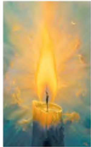
В. Куш. Свічка

У п'ятій строфі по-новому розкривається мотив виснажливої боротьби (через антитезу: сізіфова праця — весела пісня ). В античному міфі Сізіф був уособленням