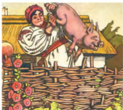
А. Базилевич. Ілюстрація до повісті І. Нечуя-Левицького «Кайдашева сім'я»

ся! – промовив спокійно Карпо, скося подивившись на Мотрю й насупивши брови.