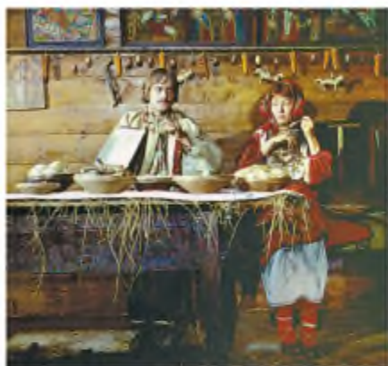
Кадр із кінофільму «Тині забутих предків» (реж. С. Параджанов)