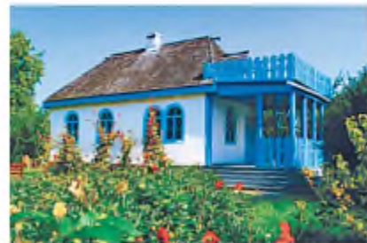
Будинок Косачів у с. Колодяжному. Сучасне фото

Якось на свято Водохреща Леся разом із братом Михайлом пішла на річку Стир подивитися, як святять воду, застудилася й захворіла. Хвороба дала ускладнення, а згодом виявилося, що в