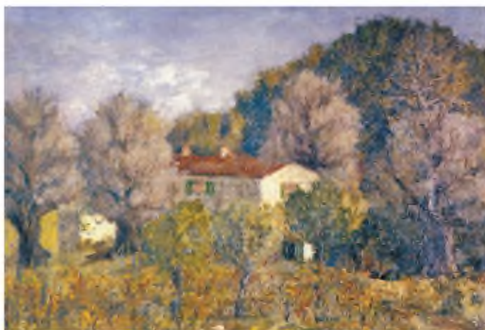
В. Винниченко, Закуток

зокрема, такі геніальні режисери, як М. Садовський, Г. Юра та Л. Курбас. З драматургом співпрацювали К. Станіславський та В. Немирович-Данченко.