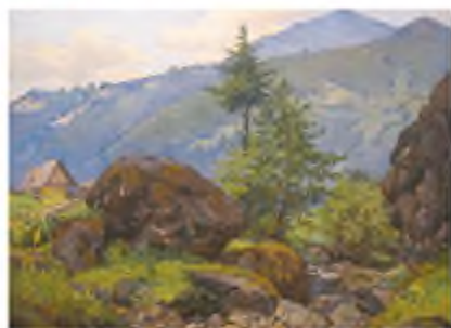
В. Винниченко. Карпатський пейзаж