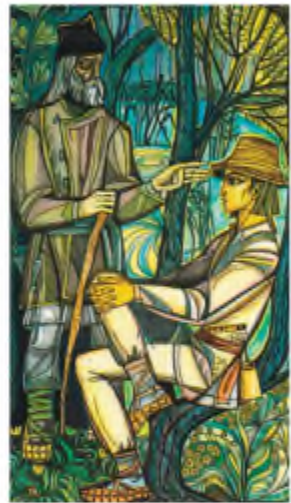
С. Караффа-Корбут. Ілюстрація до драми-феєрії Лесі Українки «Лісова пісня»

Мавка , без сумніву, ідеалізований та сильний образ: на шляху до щастя її нічого не може зупинити, лісова красуня намагається наблизити дійсність до мрії. Вона без жалю покинула заради «людського хлопця» лісові хащі й могла б знайти з людьми спільну мову, якби вони були такими мудрими, як дядько Лев . Він знав ціну краси й гармонійного співіснування людини з природою, добре знав і те, що протиставити себе природі, знехтувати її закони — значить підрубати гілку, на якій сидиш. Таке ставлення до природи дядько Лев виховував й у свого небожа Лукаша. Він не встигає переїнятися дядьковою наукою: напровесні приходить із далекого села в ліс, а восени дядько Лев помирає. Господарство прибирає до своїх рук обмежена Лукашева мати, а згодом до неї приєднується й достойна її невістка.