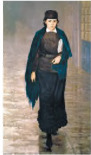
М. Ярошенко. Курьистка