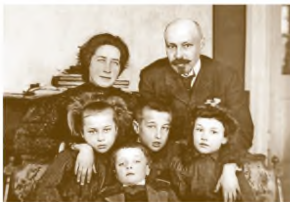
М. Коцюбинський з родиною