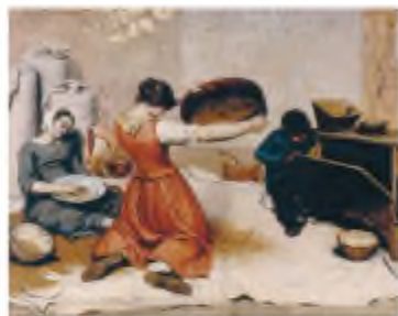
Г. Курбе. Жінки, що просіюють зерно

Аполлон Мокрицький (1810–1870) — український та російський живописець, академік Петербурзької академії мистецтв. Народився в м. Пирятині (тепер Полтавська область). Навчався в Ніжинському ліцеї. Потім виїхав до Петербурга, де став вільним слухачем Академії мистецтв. Був учнем О. Венеціанова та К. Брюллова. Працював в Україні, пізніше поїхав до Італії. У 1851–1870 рр. — професор Московського училища живопису, скульптури й архітектури. А. Мокрицький був другом Т. Шевченка, брав активну участь у вкупі поета з кріпацтва.