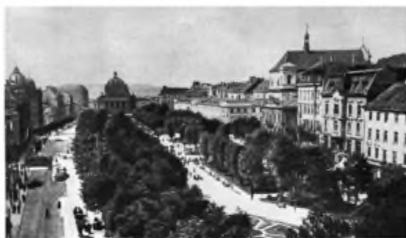
м. Львів. Друга половина XIX ст.

У 1895 р. І. Франко погодився балотуватися до парламенту. Однак австрійські власті й польські шовіністи щоразу (у 1895, 1897, 1898 рр.) удавалися до провокацій та насильства, щоб перешкодити обранню «неблаговадйного хлопського» кандидата. Особливо драматичним виявився для письменника 1897 р., коли він опинився «між двох сил». Сталося це після появи його гострокритичної статті «Поет зради» (про А. Міцкевича) і такої ж критичної щодо українського середовища передмови до збірки «Галицькі обрайки» (про цю передмову докладніше йтиметься далі). На митця посипались удари зі сторінок польської преси, яка кинулася «захищати» А. Міцкевича, а також із середовища недалекоглядних, консервативно налаштованих галицьких патріотів. У цей час унаслідок постійних цькувань, жакливої перевтоми, матеріальної скрути І. Франко тяжко захворів і майже втратив зір.