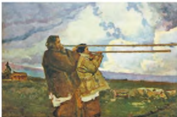
І. Труш. Трембітарі

антів: «У зелених горах», «Тіні минулого», «Голоси передвічні», «Сила забутих предків»... І зрештою вибрав назву, у якій частка таємничості й навіть містики чи не найбільша.