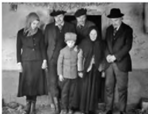
Кадр із кінофільму «Камінний хрест» (реж. Л. Осика)

за возом і скидало росу на ті сліди». Важливо ще й те, що колеса, кінські копита й п'яти Івана творять єдність своїм експресивним рухом, залишаючи сліди. А цей злитий єдністю рух, викликавши рух оточення, сполучається з ним у цілість, бо, увійшовши в гармонію з ходом копит, коліс і ніг, зілля скидає на них росу.