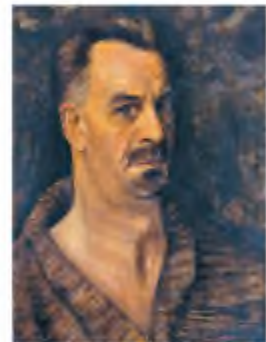
В. Винниченко. Автопортрет