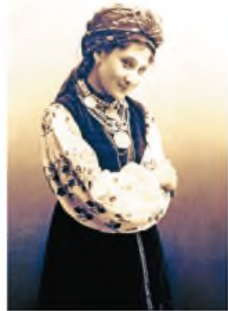
М. Заньковецька в ролі Івги Цвіркунки — у виставі М. Старицького «Чорноморці»

І все ж саме корифеї заклали основи національного драматичного мистецтва, класичного українського театру. Їхні традиції підхоплять та якісно розвинуть визначні вітчизняні майстри сцени й кінематографісти ХХ ст.