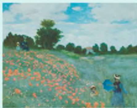
К. Моне. Поле маків