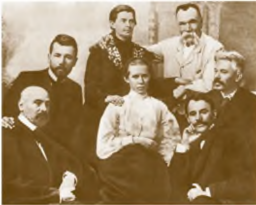
Українські письменники на відкритті пам'ятника І. Котляревському. (Зліва направо: нижній ряд: М. Коцюбинський, Леся Українка, Г. Хоткевич; верхній ряд: В. Стефаник, Олена Пчілка, М. Старицький, В. Самійленко). м. Полтава. 1903 р.

логуба, Андрія Белого. Ця наука допомогла йому відпрацювати ритмомелодику вірша, звільнитися від важкого синтаксису, одноманітного словника.