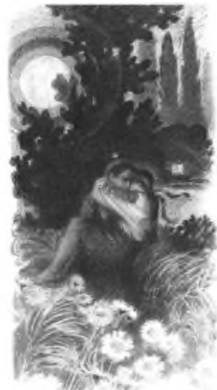
В. Чебанік. Ілюстрація до збірки Олександра Олесь «Чари ночі»