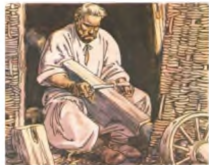
А. Базилевич. Ілюстрація до повісті І. Нечуя-Левицького «Кайдашева сім'я»