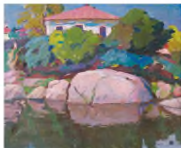
В. Винниченко. На березі