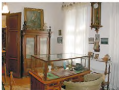
Робочий кабінет О. Кобилянської. Чернівецький літературно- меморіальний музей

О. Кобилянська померла 21 березня 1942 р. Маршрут похоронної процесії довелося узгоджувати з румунською владою. Вона не дозволила катафалку проїхати центральною вулицею, а лише коротким шляхом до цвинтаря. Родичів попередили, щоб не було ніяких промов українською мовою, але учениця письменниці – учи-