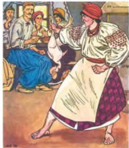
А. Базилевич. Ілюстрація до повісті І. Нечуя-Левицького «Кайдашева сім'я»

Того ж таки дня Карпа й Мотрю покликав їх кум у шинок полоскати повивач після похрестин. На Карповому дворі діти відв'язали коняку й почали їздити