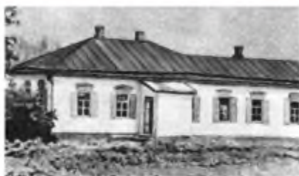
Будинок батьків Панаса Мирного та Івана Білика. м. Миргород. Фото початку ХХ ст.

тільки Іван — кремезним, а Панас — худорлявим. Відрізнялися й характерами: старший брат настирливий, рішучий, голосний, а молодший — тихий та мрійливий.