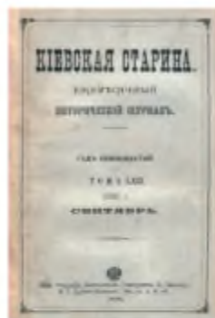
Обкладинка журналу «Киевская старина»

ській імперії та ввезення її з-за кордону. Це остаточно підірвало підвалини законної діяльності громадівців.