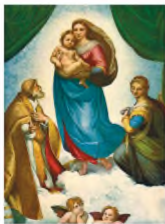
Рафаель. Сикстинська Мадонна

Цей твір з'явився під враженнями від споглядання геніальної картини Рафаеля «Сикстинська Мадонна». У сонеті звучить віра в непереможну силу високого мистецтва й владу його шедеврів над душами людей. І. Франко продовжує Шевченкову традицію возвеличення жінки-матері, він теж бачить її з немовлям на руках. Цією красою й ніжністю поет просто заворожений. Цей стан передано в сонеті за допомогою риторичних запитань, звертань та окликів: