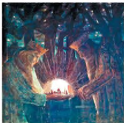
М. Чорнобильс. Казка королів

ховних лідерів народу, закликає їх не розчаровуватися, а свято вірити в досяжність ідеалів, бути витривалими й незламними.