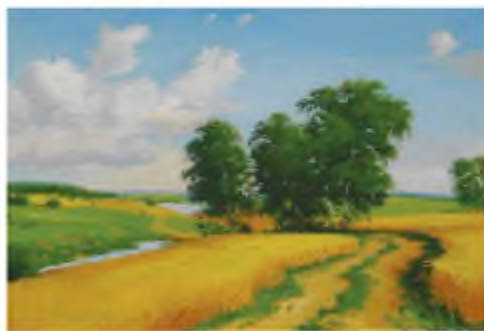
О. Болотов. Пшеничне поле

Повні вуха маю того дивного гомону поля, того шелесту шовку, того безупинного, як текуча вода, пересипання зерна. І повні очі сяйва сонця, бо кожна стеблина бере від нього й назад вертає відбитий від себе блиск.