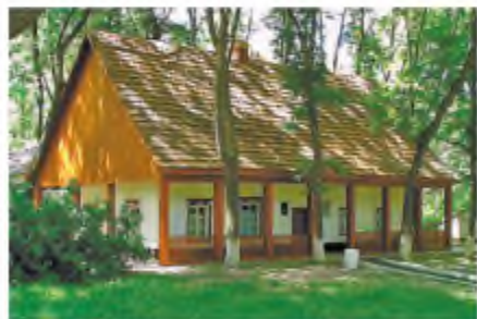
Хутір Надія. Сучасне фото