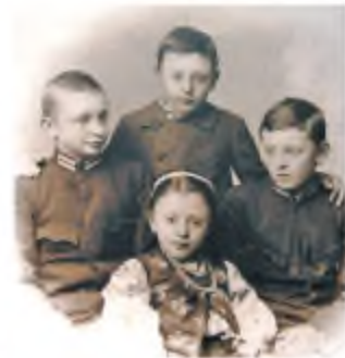
Діти І. Франка