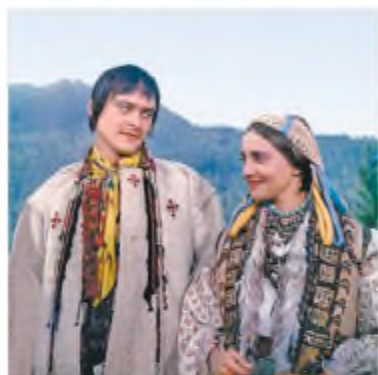
Кадр із кінофільму «Тіні забутих предків» (реж. С. Параджанов)