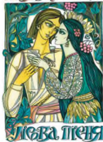
С. Караффа-Корбут. Ілюстрація до драми-феєрії Лесі Українки «Лісова пісня»

у двох парах образів: досконалого дядька Лева й ще досконалішої Мавки; примітивної матері й ще примітивнішої Килини. Отже, це суто модерністський спосіб зображення: не вплив середовища, не зіткнення з тими чи тими людьми визначають вчинки, життєву настанову Лукаша, а, навпаки, його душа зумовлює середовище: коли в ньому (Лукашеві) переважає духовна грань, вона втілюється в образах дядька Лева й згодом Мавки, коли переважає матеріальна, утілюється в образах матері, а згодом Килини.