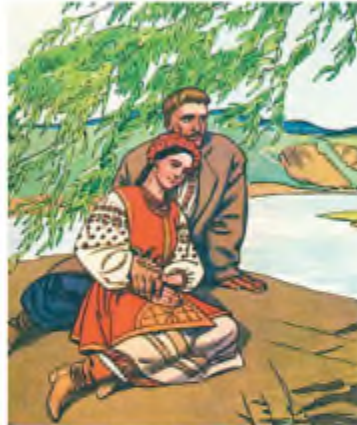
А. Базилевич. Ілюстрації до повісті І. Нечуя- Левицького «Кайдашева сім'я»

священикові, що братову жінку треба «посадити в клітку та показувати за гроші, як звірюку на ярмарках» .