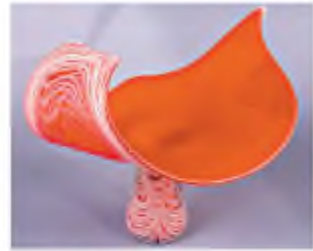
В. Геніке. Радість (цупне скло)

Інтимна лірика. У серцях кількох поколінь українців Олександр Олесь залишився насамперед як співець кохання. І справді, поет зумів досконало передати найтонші переливи цього найпрекраснішого почуття. Саме кохання, хай навіть і нерозділене, надає сенсу людському існуванню, допомагає відчувати ритм життя,