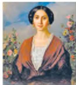
А. Мокрицький. Портрет дружини