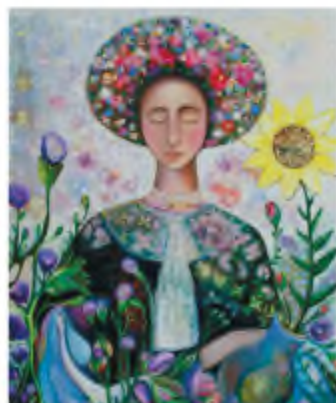
О. Гудима. «Стояла я і слухала весну...»