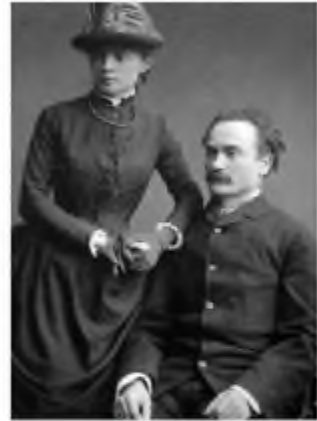
І. Франко з дружиною. 1886 р.