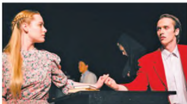
Вистава «Гріх». Театр «Браво»

собі, мені байдуже. Розкрию? Розкривайте, мені не соромно, не тяжко. Розумієте? Уся моя влада розвіється, як дим».