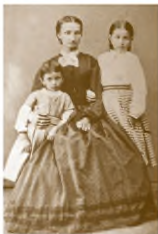
Марія Йосипівна Кобиланська з дочками Ольгою (ліворуч) і Євгенією, 1869 р.

на дрімбі 1 та цитрі 2 , які були її улюбленими інструментами.