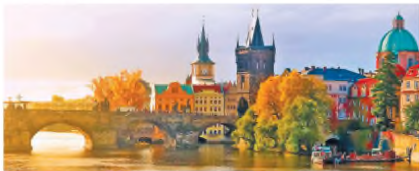
Прага – місто, у якому Олександр Олесь провів другу частину свого життя

Поета було поховано на Ольшанському кладовищі в м. Празі. Але минуло сімдесят два з половиною роки, і прах митця було перевезено до Києва. Відспівали Олександра Олесь 3 січня 2017 р. у Володимирському соборі, поховали на Лук'янівському кладовищі.