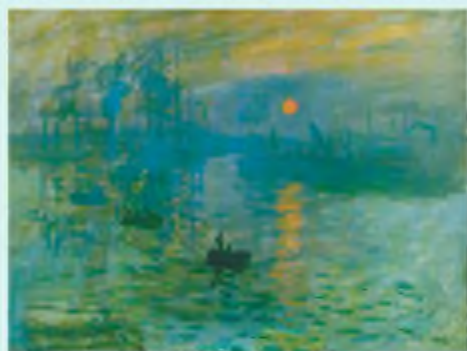
К. Моне. Враження. Схід сонця

На протигага реалістам, імпресіоністи усвідомлювали, що об'єктивна (правильна, усебічна) істина для людини недоступна, а отже, неможливо відразу охопити широку панораму буття, передати узагальнено типові обриси явища. Тому митці зосереджувалися на відтворенні миттєвих вражень від якогось явища, на щонайточнішому фіксуванні сприйнятого в конкретний момент. Через те імпресіоністичний живопис часто був мистецтвом кольорових плям, розмитих контурів, мерехтіння, а не чітких ліній і тонів. У літературі ж переважала увага до мінливих нюансів настрою, до неспинного перебігу почуттів, вражень як потоку свідомості.