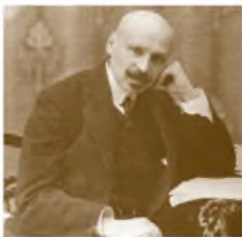
М. Жук. Портрет Михайла Коцюбинського

Цього ж року написав першу частину знаменитої повісті « Fata morgana ». А етюдом « Цвіт яблуні », написаним у 1902 р., митець засвідчив остаточний перехід від реалізму до модернізму, зокрема до імпресіоністичного стилю, про який ви дізнаєтеся трохи згодом.