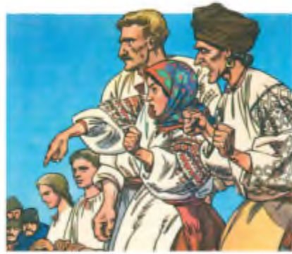
А. Базилевич. Ілюстрації до повісті І. Нечуя-Левицького «Кайдашева сім'я»