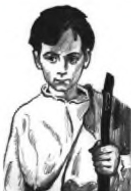
В. Свідокимов. Малює Чіпка. Ілюстрація до роману Панаса Мирного та Івана Білика «Хіба ревуть воли, як ясла повні?»

тивши, Чіпка виходить на розбійницький шлях, вороття з якого вже немає.