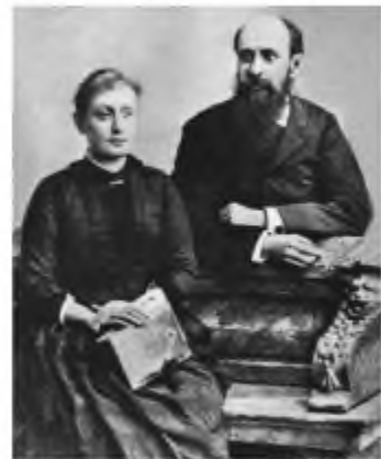
Панас Мирний з нареченою Олександрою. 1889 р.

Останні роки письменника затьмарені багатьма трагічними подіями: із життя на початку ХХ ст. пішов брат Іван, а згодом і мати, на війні загинув старший син Віктор, відійшли у вічність найближчі друзі – М. Старицький, Б. Грінченко, І. Карпенко-Карий, М. Коцюбинський, Леся Українка.