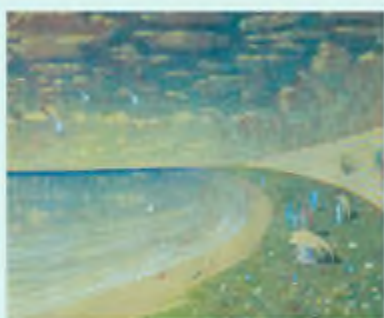
М. Чорнобиль. Рай

Дослідники звукосимволізму ( звуконпису ) переконалися, що різні звуки викликають неоднакові асоціації. Зокрема, носії української мови вважають «поганими» [х], [ш], [ж], [ц], [ф]; грубими — [д], [б], [г], [ж]; гарним, ніжним — [л]. За дослідженнями звукосимволістів, в українській мові цей звук пов'язаний із відчуттям плинності, його українці чують у звуках природи ( лити, плавати, пливти, плакати, булькати ). Наприклад, у японській мові такого звука немає, отже, ідея плинності в японців із цим звуком не пов'язується. Є мови, у яких дуже високий відсоток голосних (їх багато, наприклад,