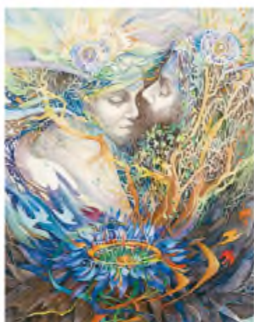
Х. Нельсон-Рід. Подвійне полум'я

побачити й оцінити красу, гармонію природи (« Ти знов прийшла...», «Ти зовсім мене не кохала...», «Ти в ту ніч другим зоріла...» ).