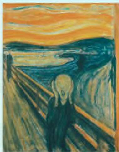
Е. Мунк. Крик

• Намагання знайти спільну основу в людині, тварині, рослині — у всьому живому. Звідси посилена увага до природи, до простих, «прозорих» характерів, не затемнених цивілізаційними нашаруваннями (виїзд П. Гогена з індустріалізованої Франції на