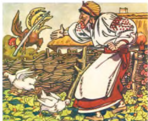
А. Базилевич. Ілюстрація до повісті І. Нечуя-Левицького «Кайдашева сім'я»

— Так, їй-богу, так. Оце добре! Мати вбила двоє курчат, перебила півневі ногу,